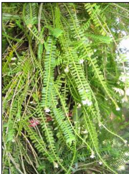
ภาพที่ 16 เอื้องใบเฟิร์น

ลักษณะทางพฤกษศาสตร์: กล้วยไม้อิงอาศัย ขนาดเล็ก ไม่มีลำตูกกล้วย กอแน่น ต้นกลมขนาดเล็ก ยาว 20–40 ซม. ใบ เรียงสลับระนาบเดียว ตั้งฉากกับต้น รูปขอบขนาน ปลายใบเว้ามนุ่ม มีติ่งแหลม โคนใบเป็นกาบหุ้มต้น สีเขียว ใบกว้าง 0.3 ซม. ยาว 0.5–0.6 ซม. ช่อดอก เป็นกระจุกแน่นออกที่ปลายยอด ห่อหุ้มด้วยกาบรูปขอบขนานปลายแหลม ดอกมีก้านครั้งละ 1 ดอก ดอก กว้างและยาว 0.7 ซม. สีขาวถึงขาวครีม กลีบเลี้ยงบน รูปไข่กลับ ปลายแหลม กว้างและยาว 0.3 ซม. กลีบเลี้ยงคู่ข้าง แหลม ขนาดใกล้เคียงกับกลีบเลี้ยงบน กลีบดอก บาง รูปขอบขนาน กว้าง 0.1 ซม. ยาว 0.3 ซม. ปลายโค้งกลับ คางลักษณะเป็นถุงกลม ยาว 0.2 ซม. ห่อหุ้มด้วยฐานของกลีบเลี้ยงคู่ข้างที่เชื่อมติดกันทางด้านหน้า กลีบปาก ฐานสีขาว หูกลีบปากห่อโอบผนังคางของเส้าเกสรด้านใน ตลอดตามยาว จนถึงยอดเกสรเพศเมีย กลีบปากส่วนกลางมีสันสีขาว ปลายกลีบปากรูปครึ่งวงกลม ตรงกลางเว้า ฝาคอรอบกลุ่มอับเรณูสีขาวบางใส