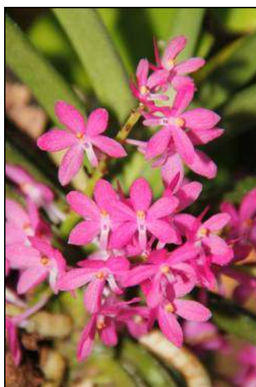
ภาพที่ 20 เอื้องเข็มม่วง

ชื่ออื่น: พุ่มสุวรรณ เอื้องไขเหลืออง เอื้องมันปู เอื้องซี่ครึ่ง เอื้องครึ่งฝอย