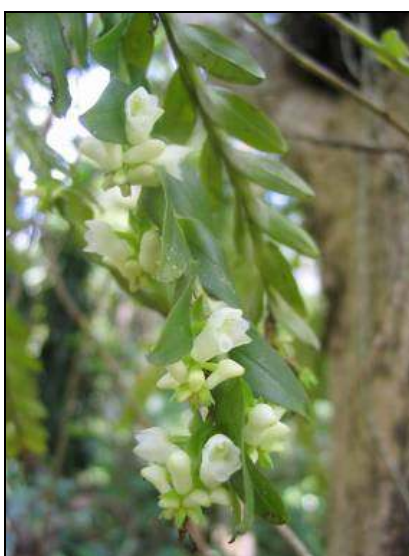
ภาพที่ 18 หางแมงเงา

ลักษณะทางพฤกษศาสตร์: กิ่งยวไม่อิงอาศัย เจริญทางข้าง รากฝอย ลำต้นไม่มีลำลูกกล้วย ทอดตัวยาว ห้อย ยาวได้ถึง 50 ซม. ใบ เรียงสลับ รูปรี ปลายเว้าบวม มีติ่งแหลมยื่นตัว ซึ่งเป็นส่วนของเส้นกลางใบที่เจริญพ้นออกมา โคนใบเป็นกาบหุ้มรอบข้อ ใบกว้าง 1 ซม. ยาวได้ถึง 3 ซม. ผิวใบมัน ช่อดอก สั้น เกิดที่ปลายยอด ดอกเป็นกระจุก ใบประดับดอกสีเขียว พับกลับ ดอก กว้าง 0.5 ซม. ยาว 0.75 ซม. ดอกบานสีขาวและจะเปลี่ยนเป็นสีเหลือง กลีบเลี้ยงบน กว้าง 0.25 ซม. ยาว 0.4 ซม. กลีบเลี้ยงคู่ข้าง บาง กว้างและยาว 0.4 ซม. เชื่อมติดกันบริเวณด้านหน้าของกลีบปาก กลีบดอก รูปรี ปลายแหลม กว้าง 0.35 ซม. ยาว 0.4 ซม. กลีบปาก ยาว 0.6 ซม. ด้านในมีผนังรูปตัว U เพิ่มเข้ามาอีกชั้นหนึ่ง ปลายกลีบปากพับลงตรงกลางเว้าบวมและมีติ่งยื่น รอยพับของปลายกลีบปากมีเนื้อเยื่อเป็นติ่งยื่น สีขาวออกเหลือง ฝาครอบกลุ่มอับเรณูแหลมชี้ไปข้างหน้า สีขาวออกเหลือง อับเรณูสีเหลือง