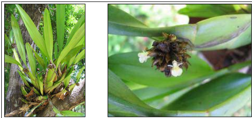
ภาพที่ 15 เอื้องปีกไก่

ลักษณะทางพฤกษศาสตร์: กล้ายไม้อิงอาศัย เจริญทางข้าง แตกกอแน่น รากกิ่งอากาศ ลำลูกกล้วยสีเขียวเข้ม แบน เจริญโค้งขึ้น กว้าง 2.5 ซม. ยาว 20 ซม. ใบ เรียงสลับ รูปขอบขนาน ปลายมนเว้าบวม โคนใบเป็นกาบขอบกาบสีน้ำตาลเกือบดำ ใบบิด กว้าง 2.5–2.7 ซม. ยาว 17–20 ซม. ช่อดอก ออกเป็นกระจุกที่ยอดลำลูกกล้วย เส้นผ่านศูนย์กลาง 1.5–2.5 ซม. มีกาบหุ้มช่อและดอกแห้งสีน้ำตาล เข้มติดอยู่ ดอกในช่อบานครั้งละ 1–2 ดอก ดอก ขนาดเล็ก ดอกสีขาวครีม กว้างและยาว 0.5 ซม. กลีบเลี้ยงบน รูปขอบขนาน ปลายแหลม กว้าง 0.15 ซม. ยาว 0.4 ซม. กลีบเลี้ยงคู่ข้าง รูปขอบขนาน ปลายเรียวแหลม กว้าง 0.15 ซม. ยาว 0.5 ซม. กลีบดอก กางออก รูปแถบ กว้างไม่ถึง 0.1 ซม. ยาว 0.3 ซม. กลีบปาก สีขาว หูกลีบปากปลายมนสีเหลือง ปลายกลีบปากรูปครึ่งวงกลม พับลงเกือบทำมุมฉากกับกลีบปากช่วงโคน กว้าง 0.45 ซม. ยาว 0.3 ซม. ขอบหยักเป็นริ้วละเอียดตรงกลางเว้าบวม เส้น เกสรสีขาว