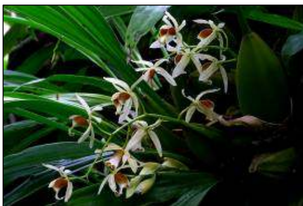
ภาพที่ 34 เอื้องหมาก

ลักษณะทางพฤกษศาสตร์: กล้วยไม้อิงอาศัย เจริญทางข้าง เหง้ากลม ลำลูกกล้วยรูปไข่ เส้นผ่านศูนย์กลาง 3 ซม. ยาว 10 ซม. มีใบสองใบ ใบ กว้าง 3 ซม. ยาว 40 ซม. ก้านใบยาว 7 ซม. ช่อดอก ออกที่แขนงอ่อนซึ่งใบและลำลูกกล้วยยังไม่เจริญเต็มที่ ยาว 30 ซม. ทอยอบานจากโคนสู่ปลายช่อ กลิ่นหอมอ่อน ๆ ดอก กว้างประมาณ 4 ซม. สีครีมอมเขียวอ่อน กลีบเลี้ยงบน รูปใบหอก ปลายเรียวแหลม กว้าง 0.6 ซม. ยาว 1.8 ซม. หลังกลีบมีสันหนึ่งสัน กลีบเลี้ยงคู่ข้าง ไม่สมมาตร กลีบดอก รูปขอบขนาน กว้าง 0.25 ซม. ยาว 1.8 ซม. กลีบปาก รูปไข่ ฐานเกตร่อง กว้าง 1.4 ซม. ยาว 1.8 ซม. หูกลีบปากตั้งขึ้น ปลายมน สีน้ำตาล ตรงกลางมีสันสีขาวหยักเป็นซี่ฟันละเอียด 3 สัน ปลายกลีบปากมีสีน้ำตาลแต้ม ด้านข้างมีสันสั้น ๆ ข้างละสัน สันกลางแตกสันเล็ก ๆ 3 สัน