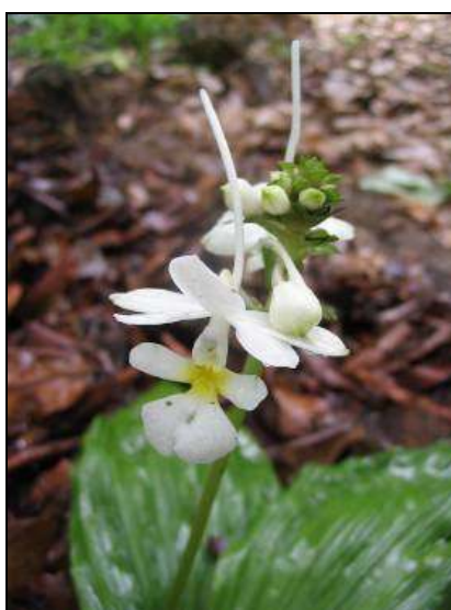
ภาพที่ 30 กาลันเตขาว

ลักษณะทางพฤกษศาสตร์: กล้ายไม้ดิน พบได้ตามป่าดิบชื้น เจริญทางข้าง แตกกอ เหง้าอยู่ใต้ดิน แต่ละต้นมีใบหลายใบ ใบ รูปไข่กลับ แผ่นใบกว้าง 10 ซม. ยาว 30 ซม. ก้านใบยาว 15 ซม. ปลายใบเรียวแหลม โคนใบสอบเรียว แผ่นใบไม่เรียบ มีรอยพับจีบตามยาว เส้นใบขนาน ช่อดอก เป็นกระจุกออกที่ยอด ตั้งขึ้น ยาวได้ถึง 45 ซม. แกนช่อดอกสั้น บานทนหลายวัน ดอกสีขาว กลีบเลี้ยง รูปรี กว้างประมาณ 1 ซม. ยาวประมาณ 1.6 ซม. กลีบดอก รูปไข่กลับ กว้างประมาณ 1 ซม. ยาวประมาณ 1.5 ซม. กลีบปาก มีเดือยคล้ายหางหนู โคนงุ้มขึ้นมาข้างหน้า ยาว 3–5 ซม. หูกลิบบากกางออกฐานกว้าง ปลายมน ปลายกลีบปากคล้ายพัด ตรงกลางหยักลึก ขอบหยักละเอียด มีสีเหลืองแต้มตรงฐานของกลีบปาก