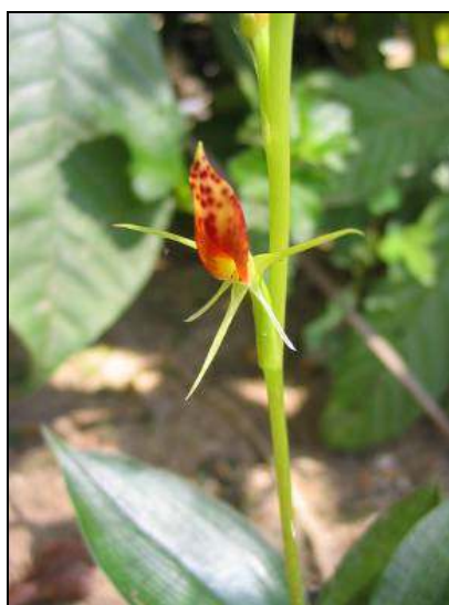
ภาพที่ 37 เอื้องแมงมุม

ลักษณะทางพฤกษศาสตร์: กล้วยไม้ดิน เจริญทางข้าง สูง 20–60 ซม. ใต้ดินมีเหง้า มี 1–4 ใบ ใบ รูปไข่ ปลายแหลม ก้านใบพอมและยาว มีจุดสีม่วงแต้ม ใบกว้าง 3.5–7 ซม. ยาว 7–12 ซม. สีเขียวเป็นมัน เห็นร่างแหเส้นใบได้อย่างชัดเจน ช่อดอก ตั้งขึ้น เกิดที่ยอด สีเขียวอ่อน ยาว 10–30 ซม. ดอกในช่อ ทอยบานจากโคนสู่ปลายช่อ ขณะบานดอกหงายขึ้น กว้าง 2.5 ซม. กลีบเลี้ยงและกลีบดอก รูปแถบ ปลายเรียวแหลม สีเขียวอ่อน เมื่อดอกบานเต็มที่มีมันตัวคล้ายหลอด ยาว 1.5 ซม. กลีบปาก ชี้นขึ้น รูปไข่ โคนเป็นร่อง กว้าง 0.6 ซม. ยาว 1.6 ซม. สีส้มแดง ปกคลุมด้วยขนละเอียดสีม่วงแดง ปลายกลีบปากมีความหนาแน่นของกลุ่มขนที่ไม่สม่ำเสมอ เห็นเป็นจุดแต้มสีม่วงแดงขนาดไม่เท่ากันอยู่ทั่วไป เส้าเกสรเล็กและสั้น