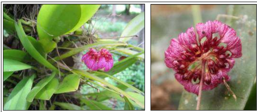
ภาพที่ 25 สิงโตร่มแดง

ลักษณะทางพฤกษศาสตร์: กล้วยไม้อิงอาศัย เจริญทางข้าง รากกิ่งอากาศ มีเหง้าทอดยาว ลำลูกกล้วยรูปไข่ กว้าง 1–1.2 ซม. สูง 1.5 ซม. มีใบเดี่ยว ใบ รูปขอบขนานแกมรูปรี กว้าง 3–3.5 ซม. ยาว 10–16 ซม. แผ่นใบค่อนข้างหนา ปลายใบมน หักตั้ง ๆ ช่อดอก เกิดที่ฐานลำลูกกล้วย ตั้งขนานกับพื้นดิน เส้นผ่านศูนย์กลางช่อประมาณ 2.8 ซม. ดอก เป็นกระจุกที่ปลาย มี 8–12 ดอก บานพร้อมกัน เรียงตัวในแนวรัศมี เกือบเป็นวงกลม สีแดงอมม่วงหรือม่วงเข้ม กลีบเลี้ยงบน จุ่มห่อตัว ชี้ไปข้างหน้า กว้าง 0.3 ซม. ยาว 0.7 ซม. ปลายกลีบเป็นขนยาวคล้ายเส้น ขอบกลีบมีขนสีม่วง กลีบเลี้ยงคู่ข้าง ทั้งสองขอบเชื่อมติดกัน โค้งลงคล้ายลิ้น แต่ละกลีบกว้าง 0.25 ซม. ยาว 1 ซม. กลีบดอก ไม่สมมาตร กว้าง 0.25 ซม. ยาว 0.5 ซม. ปลายกลีบเป็นขนยาวคล้ายเส้น ขอบกลีบมีขนสีม่วง กลีบปาก เคลื่อนไหวได้ รูปสามเหลี่ยม หนา โค้งลง ยาว 0.3 ซม. ด้านล่างสีเหลืองอ่อน ด้านบนสีม่วงเข้ม เส้าเกสรสีเหลือง ฝากรอบกลุ่มอับริณสีเหลือง