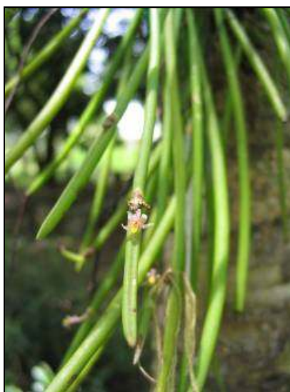
ภาพที่ 32 เอื้องต้นหอม

ลักษณะทางพฤกษศาสตร์: กล้ายไม้อิงอาศัย เจริญทางข้าง รากฝอย กอเป็นกระจุก ต้นทรงกระบอก ห้อยโค้งลง ใบ คล้ายทรงกระบอก เชื่อมกับต้นที่บริเวณข้อ ข้อมีกาบสีเหลืองอมเขียวหุ้มรอบ เส้นผ่านศูนย์กลางใบ 0.3 ซม. ยาว 2–4 ซม. ปลายใบแหลม ช่อดอก เกิดที่ฐานใบ มีกาบแห้งคล้ายฟางเป็นกระจุกที่โคนข้อ มีดอกเดี่ยว ดอกขนาดเล็ก สีเหลืองหรือสีแดงอมม่วงอ่อน กลีบเลี้ยงบน รูปใบหอก โค้งขึ้นไปทางด้านหลัง ฐานกว้าง 0.1 ซม. ยาว 0.4 ซม. กลีบเลี้ยงคู่ข้าง รูปใบหอก ม้วนลง ขนาดใกล้เคียงกับกลีบเลี้ยงบน ฐานกลีบเกิดเป็นคาง ขอบกลีบเชื่อมกันด้านหน้าดอก กลีบดอก รูปใบหอก ปลายแหลม ฐานกว้าง 0.1 ซม. ยาว 0.2 ซม. บางใส โค้งขึ้นไปทางด้านหน้า กลีบปาก รูปไข่กลับ เชื่อมติดกับโคนเส้าเกสร ยาว 0.4 ซม. โคนสีม่วงแดงมีแถบคล้ายสันนูนสีแดงเข้ม 2 แถบ กลางกลีบสีเหลืองอ่อน ปลายกลีบหนา มีร่องสีเหลืองเข้ม เส้าเกสรสีขาวครีม