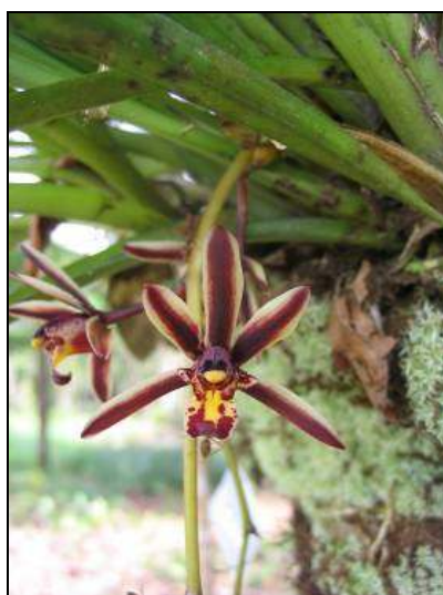
ภาพที่ 38 กะเรกะร่อน

ลักษณะทางพฤกษศาสตร์: กล้ายไม้อิงอาศัย เจริญทางข้าง กอเป็นกระจุก รากกิ่งอากาศ โคนต้นป้องเล็กน้อย ใบ เรียงสลับ ชี้ขึ้น สีเขียวอ่อน รูปขอบขนาน กว้าง 1–1.5 ซม. ยาวไม่เกิน 45 ซม. แผ่นใบเรียบ ค่อนข้างหนา ปลายใบเปี้ยว ช่อดอก ออกที่โคนต้น ห้อยลง สีม่วงสด ยาวไม่เกิน 25 ซม. ดอก มีกลิ่นหอม กว้าง 3.6 ซม. ขอบสีเหลืองอ่อน ตรงกลางสีม่วงเข้ม กลีบเลี้ยงบน ชี้ขึ้น รูปขอบขนาน ปลายแหลม กว้าง 0.5 ซม. ยาว 2 ซม. กลีบเลี้ยงคู่ข้าง กางออก ไม่สมมาตร ขนาดเท่า ๆ กลีบเลี้ยงบน กลีบดอก รูปขอบขนานแกมรูปรี กว้าง 0.5 ซม. ยาว 1.8 ซม. กลีบปาก กว้าง 1.2 ซม. ยาว 1.5 ซม. ผนังของกลีบปากด้านในสีเหลืองอ่อน แต้มด้วยจุดสีม่วงแกมน้ำตาล ฐานกลีบปากไว้ลึกลงคล้ายหลุม ปลายกลีบปากฐานสีเหลือง ปลายแหลมสีม่วงเข้ม โค้งลงเกือบม้วน เส้าเกสรโค้ง สีม่วง ขอบยอดเกสรเพศเมียสีม่วงเข้ม ฝากรอบกลุ่มอับเรณูสีเหลืองถึงเหลืองเข้ม แต้มด้วยสีม่วงจาง ๆ