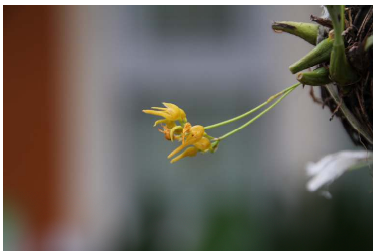
ภาพที่ 28 สิงโตโคมไฟ

ลักษณะทางพฤกษศาสตร์: กล้วยไม้อิงอาศัย เจริญทางด้านข้าง ลำลูกกล้วยรูปทรงกระบอก กว้าง 0.5 ซม. ยาว 2 ซม. มีข้อเดียว มีร่องตื้นตามยาว 4–6 ร่อง แต่ละล้าอยู่ห่างกันบนเหง้าขนาดเล็ก ใบรูปขอบขนาน หนาและแข็ง กว้าง 1.8 ซม. ยาว 4 ซม. มีใบเดียว ปลายใบเว้าบวม มีอายุหลายฤดูก่อนหลุดร่วงที่ข้อต่อ ช่อดอก กิ่งช่อม มีข้อเดียวเกิดที่โคนลำลูกกล้วย เส้นผ่านศูนย์กลางช่อ 1.2–1.5 ซม. ดอก ขนาด 0.6 ซม. เรียงเป็นกระจุกแน่น มีกลิ่นหอม กลีบเลี้ยง รูปขอบขนานแกมรูปไข่จนถึงรูปหอกแกมรูปไข่ ปลายกลีบมน กลีบดอก รูปไข่ เบี้ยว ปลายกลีบแหลม ทั้งห้ากลีบสีขาวครีม และปลายปีกมักเป็นสีส้ม กลีบปาก รูปขอบขนาน อวบอ้วน ปลายกลีบไม่โค้งงอลง เส้าเกสรเล็กและสั้น ที่ปลายมีรยางค์คล้ายเขี้ยวยื่นขึ้น