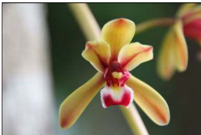
ภาพที่ 39 กะเรกะร่อนปากเปิด

ลักษณะทางพฤกษศาสตร์: กล้วยไม้อิงอาศัย เจริญทางข้าง รากกิ่งอากาศ กอแน่น ต้นเป็นเหง้าทอดยาว แตกแขนง ใบจำนวนมาก ใบ เรียงสลับ รูปขอบขนาน ปลายใบมน เว้าปุ่มเบี้ยว แผ่นใบหนา ค่อนข้างเรียบ กลางใบเป็นร่องตลอดความยาว ใบกว้างได้ถึง 4 ซม. ยาวได้ถึง 1 ม. ช่อดอก ออกที่โคนต้น ยาวได้ถึง 1 ม. ห้อยลง โคนช่อมีใบประดับซ้อนกันหลายใบ ดอก เหลืองแกมน้ำตาล มีกลิ่นหอม กว้าง 5 ซม. ยาว 4.6 ซม. สี กลีบเลี้ยง รูปขอบขนาน ปลายมนหรือแหลม กว้าง 0.8–0.9 ซม. ยาว 3 ซม. กลางกลีบมีแถบสีม่วงเข้ม กลีบดอก ไม่สมมาตร ปลายแหลม กว้าง 1 ซม. ยาว 2.5 ซม. ชี้นอนไปข้างหน้าอยู่ชิดติดกับกลีบเลี้ยงบน กลีบปาก ยาว 2.6 ซม. ชี้นอนไปข้างหน้า กลีบปากช่วงล่างขอบห่อตัวโค้งขึ้น ด้านนอกสีม่วงเข้ม ด้านในมีแถบสีม่วงจางและเข้มสลับกัน กลางกลีบมีสันนูน 2 สันสีม่วงแดง ปลายสันสีเหลือง หูกลีบปากแหลม ชี้นอนไปข้างหน้า ปลายกลีบปากรูปรี ม้วนลง เส้นแวงโค้งสีเหลืองแกมน้ำตาล แต้มด้วยจุดประสีม่วง ยาว 1.8 ซม.