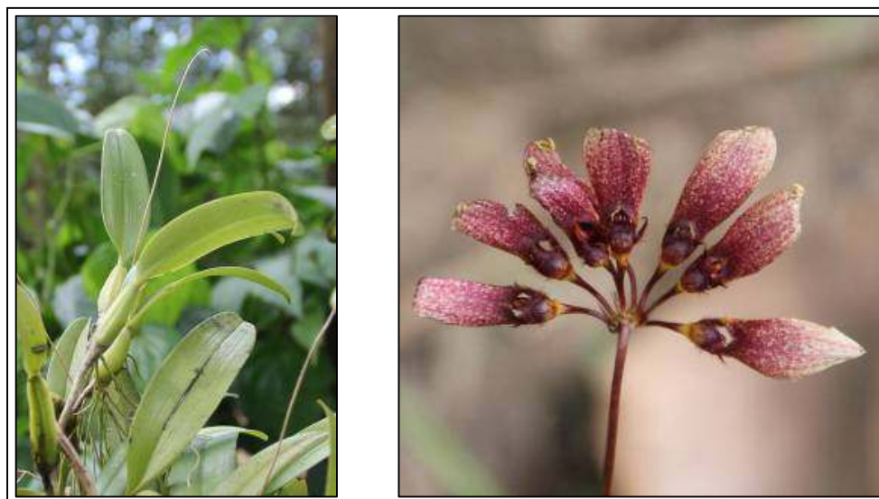
ภาพที่ 26 สิงโตพัตแดง

ลักษณะพฤกษศาสตร์: กล้ายไม้อิงอาศัยขนาดค่อนข้างเล็ก เจริญด้านข้าง ต้นเป็นเหง้าทอดยาว ลำลูกกล้ายรูปไข่ กว้าง 1–1.5 ซม. ยาว 1.5–2.5 ซม. ใบ รูปแถบหรือรูปใบหอกกลับ มี 1 ใบ กว้าง 1.4–1.8 ซม. ยาว 10–15 ซม. แผ่นใบค่อนข้างหนาและเหนียว ช่อดอก ยาวเท่า ๆ ใบ ก้านช่อดอกเหนียว สีแดงอมม่วง ปลายสุดมีดอก 7–10 ดอก เรียงตัวแผ่แบนในแนวรัศมี คล้ายรูปครึ่งวงกลมหรือรูปพัด ดอก สีน้ำตาลอมม่วง กว้าง 0.5–0.7 ซม. ยาว 1.5–2 ซม. กลีบเลี้ยงคู่ข้าง รูปขอบขนานแกมรูปหอกยื่นยาว ปิดตัวจนขอบนอกของกลีบมาเชื่อมติดกันจนมีลักษณะคล้ายรูปไข่กลับ กลีบเลี้ยงบน สั้น กลม ปลายแหลม ผิวด้านนอก สีน้ำตาลอมม่วง กลีบดอกคู่ข้าง มีลักษณะคล้ายกับกลีบเลี้ยงบน ปลายกลีบปากสีเหลือง เส้นเกสรสั้น มีคางยื่นยาว มีฝาคีบรอบ กลุ่มเรณูมี 4 กลุ่ม ไม่มีก้านและแป้นก้านกลุ่มเรณู