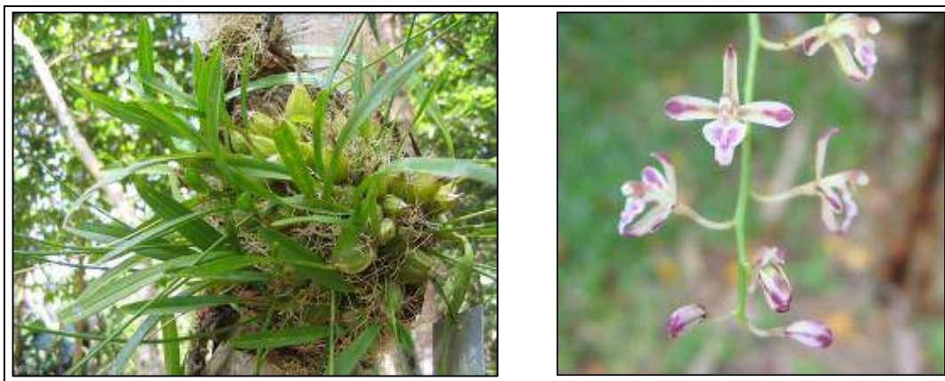
ภาพที่ 12 เอื้องนมหนู

ลักษณะทางพฤกษศาสตร์: กล้วยไม้อิงอาศัย เจริญทางข้าง รากฝอยสีขาว ลำลูกกล้วยอ้วนป้อม รูปไข่ อยู่ชิดติดกัน มีสัน เส้นผ่านศูนย์กลาง 1.2 ซม. ยาว 2.5–5 ซม. มีใบที่ยอด 2 ใบ ใบ รูปแถบ ปลายมน แผ่นใบโค้ง บาง กว้าง 0.8–1.2 ซม. ยาว 7–20 ซม. ช่อดอก แตกแขนง เกิดจากเหง้าใต้โคนลำลูกกล้วย ยาวได้ถึง 40 ซม. ดอก จำนวนมาก กว้าง 1–1.2 ซม. ยาว 0.8 ซม. กลีบเลี้ยงบน รูปแถบ กว้าง 0.1–0.15 ซม. ยาวประมาณ 0.6 ซม. สีเหลืองอมส้ม มีหรือไม่มีแถบสีม่วงตรงกลาง กลีบเลี้ยงคู่ข้าง เชื่อมติดกัน กว้าง 0.15 ซม. ยาว 0.5 ซม. สีและลักษณะคล้ายกลีบเลี้ยงบน กลีบดอก รูปแถบ ปลายมน กว้าง 0.2 ซม. ยาว 0.5 ซม. หลังกลีบมีแถบสีม่วง กลีบปาก เกิดจากฐานหลอดเส้าเกสร ยาว 0.5–0.6 ซม. กลีบปากช่วงโคนฐานแคบ หูกลีบปากแผ่ออกข้าง ขอบสีขาว ตรงกลางสีม่วง กลีบปากช่วงกลางมีสันนูน 2 สัน สีม่วง ปลายกลีบปากรูปแถบปลายมน ขอบสีขาว ตรงกลางสีม่วง เส้าเกสรสีม่วงอมน้ำตาล ปลายสีเหลืองอ่อน ฝากรอบกลุ่มอับเรณูสีเหลือง กลุ่มอับเรณูสีเหลืองทอง