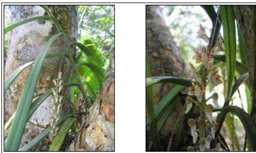
ภาพที่ 33 เอื้องใบกิว

ลักษณะทางพฤกษศาสตร์: กล้วยไม้อิงอาศัยขนาดกลาง เจริญทางยอด กอโปร่ง รากกิ่งอากาศ ใบเรียงสลับ รูปขอบขนาน กว้าง 1.5 ซม. ยาว 20–30 ซม. แผ่นใบหนา ปลายใบเรียวแหลม ช่อดอก ออกที่ข้อ ห้อยลง ไม่แตกแขนง ยาว 15 ซม. หรือมากกว่า ช่อดอกค้อย ๆ ยึดตัวออกไปพร้อม ๆ กับดอกที่ทยอยบานจากโคนสู่ปลายช่อ ดอก กว้าง 1 ซม. ยาว 1.2 ซม. สีม่วงอมน้ำตาล ขอบและตรงกลางกลีบสีเขียวยอ่อน เมื่อแก่เป็นสีเหลือง กลีบเลี้ยงบน รูปไข่กลับ ปลายแหลม กว้าง 0.3 ซม. ยาว 0.5 ซม. กลีบเลี้ยงคู่ข้าง ไม่สมมาตร ขนาดใกล้เคียงกับกลีบเลี้ยงบน กลีบดอก รูปไข่กลับ ปลายแหลม กว้าง 0.15 ซม. ยาว 0.3 ซม. กลีบปาก อวบน้ำ คล้ายหัวลูกศร ฐานกว้าง 0.25 ซม. ยาว 0.3 ซม. ฐานสีม่วงอ่อน ปลายกลีบปากสีขาว หูกลีบปากเรียวแหลม โคนคล้ายเคียว เตี้ยเรียวสีขาว ชี้ลง เส้าเกสรอวบน้ำหนาฝากรอบกลุ่มอับเรณูขนาดเล็ก กลุ่มอับเรณูสีเหลืองใส