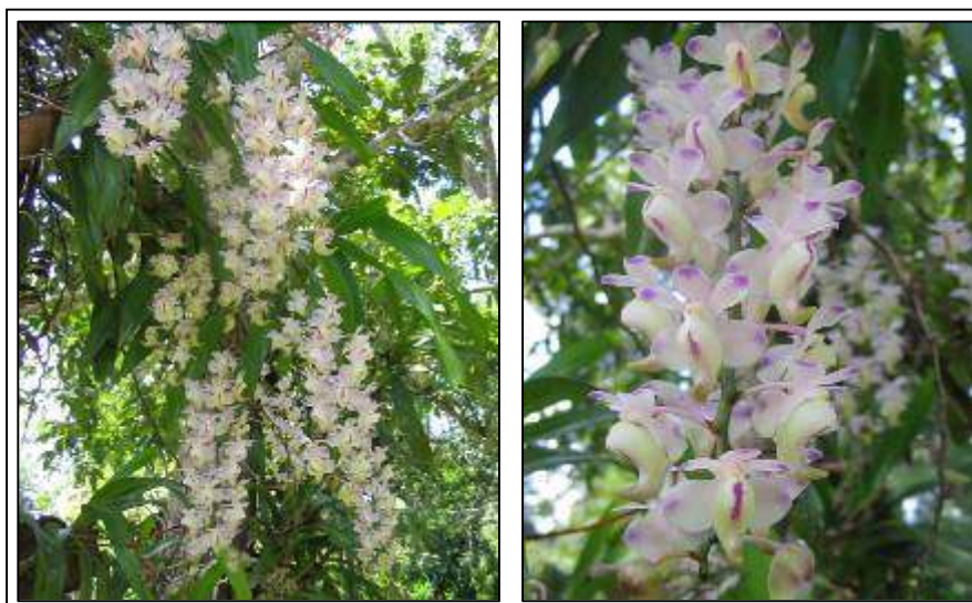
ภาพที่ 13 เอื้องกุหลาบกระเป๋ापิด

ชื่ออื่น: ม้าหมูย เอื้องกุหลาบขาว เอื้องพวงกุหลาบ เอื้องเป็ดน้อย เอื้องกุหลาบเตี้ยไก่