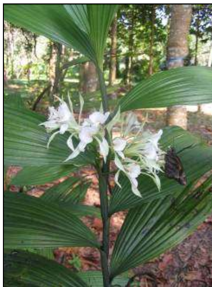
ภาพที่ 36 ว่านหางหนูมาน

ชื่ออื่น: กลอนคู่ ตาริอาซู เหล็กนางยอง อ้ายเหล็ก เอื้องลิลา