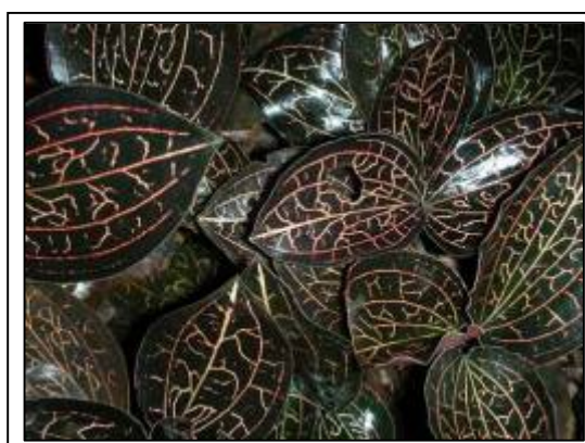
ภาพที่ 17 ว่านน้ำทอง

ลักษณะทางพฤกษศาสตร์: กล้วยไม้ขนาดเล็ก อาศัยบนดิน เจริญทางด้านข้าง ลำต้นอวบน้ำรูปทรงกระบอก ทอดเลื้อยชูส่วนยอดขึ้น ใบ รูปรีจนถึงรูปรีแกมรูปไข่ กว้าง 2 ซม. ยาว 3 ซม. สีน้ำตาลแกมม่วง และมีลายร่างแหสีทองแดง แผ่นใบมีขน ช่อดอก ยาว 5–8 ซม. ดอกขนาด 1 ซม. ทั้งช่อดอก ใบประดับดอก ก้านดอกและรังไข่มีขนปกคลุม กลีบเลี้ยงบน รูปรี กลีบเลี้ยงคู่ข้าง รูปขอบขนานแกมรูปรีและเบี้ยว ทั้งสามกลีบสีน้ำตาลแกมม่วงคล้ำ ด้านนอกมีขนแข็ง กลีบดอก เบี้ยว สีขาว ปลายกลีบแหลมและเชื่อมกับกลีบเลี้ยงบน กลีบปาก สีขาวอยู่ทางด้านบน มีรยางค์คล้ายไส้ยื่นยาวข้างละ 3–4 อัน ปลายกลีบเป็นแฉกรูปขอบขนานแผ่กาง 45 องศา