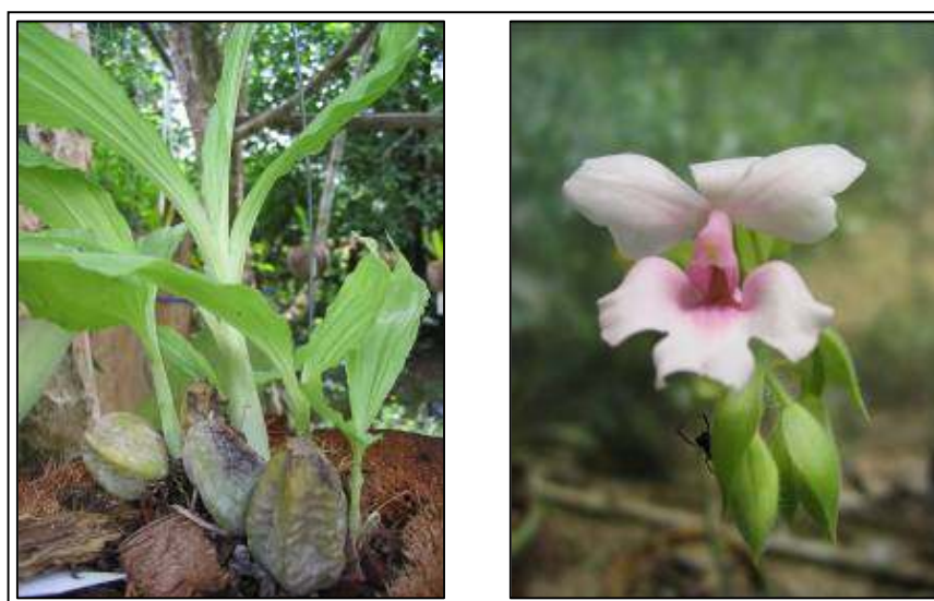
ภาพที่ 31 เอื้องน้ำเต้า

ลักษณะทางพฤกษศาสตร์: กล้วยไม้ดิน เจริญทางข้าง ลำลูกกล้วยมี 2–3 ปล้อง ปล้องล่างคอดเข้า คล้ายผลน้ำเต้า ลำลูกกล้วย กว้าง 3–4 ซม. ยาว 7–8 ซม. ใบ รูปใบหอก กว้างได้ถึง 15 ซม. และ ยาวได้ถึง 40 ซม. พับจีบ ทั้งใบช่วงหน้าแล้งพร้อมออกดอก ช่อดอก แบบช่อกระจະ ออกที่โคนลำลูกกล้วย ช่อดอกตั้งขึ้น ปลายช่อโค้ง มีขนสีขาวปกคลุม ยาวได้ถึง 50 ซม. มีหลายดอก ดอก กว้าง 3.5–4 ซม. ยาว 3.5 ซม. ดอกสีชมพูอ่อนจนถึงชมพูเข้ม กลางกลีบปากอาจมีหรือไม่มีแถบสีม่วง กลีบเลี้ยงบน รูปรีปลายเป็นติ่งแหลม กว้าง 0.8 ซม. ยาว 1.5 ซม. กลีบปาก กว้าง 2 ซม. ยาว 1.6 ซม. หูกลีบปากมีขนาดใหญ่กว่าปลายกลีบปาก รูปครึ่งวงกลม บานแผ่ออก ปลายกลีบปากรูปพัด ตรงกลางหยักลึก โคนของกลีบปากเชื่อมกับเส้าเกสรเป็นหลอด กลีบมีเดือยยาวคล้ายหางหนู ฝากรอบกลุ่มอับเรณูสีออกขาว กลุ่มอับเรณูสีเหลือง