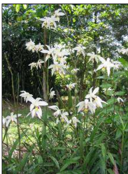
ภาพที่ 23 กล้วยไม้ดิน

ลักษณะทางพฤกษศาสตร์: กล้วยไม้ดินขนาดใหญ่ รากฝอย มีเหง้าใต้ดินแตกกอ ต้นขึ้นชิดกัน ตั้งตรง สูง 1–2 ม. ใบ หนา แข็ง เรียงสลับ ใบรูปขอบขนาน ปลายใบเว้าบวม โคนใบเป็นกาบสีเขียวหุ้มรอบข้อ ใบกว้างได้ถึง 3 ซม. ยาวได้ถึง 12 ซม. ใบอ่อนสีม่วง ช่อดอก สีเขียวออกที่ปลายยอด ตั้งตรงขึ้น ยาวประมาณ 10 ซม. ก้านดอกย่อยสีม่วง ดอก กว้าง 4.5–5 ซม. ยาว 5.5 ซม. กลีบเลี้ยง สีขาว หรือขาวครีม รูปขอบขนานแกมรูปหอก ด้านหลังมีหรือไม่มีเส้นสีม่วงจาง ๆ พาดตลอดความยาว กว้าง 0.6–0.9 ซม. ยาว 2.8–3.8 ซม. กลีบดอก สีขาวหรือขาวครีม รูปขอบขนานแกมรูปรี กว้าง 1.2 ซม. ยาว 3 ซม. กลีบปาก รูปไข่กลับ กว้าง 1.5 ซม. ยาว 2.5 ซม. หูกลีบปากตั้งขึ้น สีขาว มีเส้นสีม่วงเข้ม ปลายกลีบปากรูปครึ่งวงกลมโค้งหรือพับลง ปลายแหลมเป็นติ่ง ขอบปลายกลีบปากบาง หยักเป็นริ้วสีขาว ตรงกลางของปลายกลีบปากมีเนื้อเยื่อनुสีเหลือง เส้นเกสรสีขาวหรือขาวครีม โคนด้านในสีม่วง ฝาดรอบกลุ่มอับเรณูสีขาวครีม