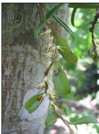
ภาพที่ 24 สิงโตสายสร้อย

ลักษณะทางพฤกษศาสตร์: กล้วยไม้อิงอาศัยขนาดเล็ก รากกิ่งอากาศ เหง้าพอมทอดตัวยาว ห้อยลงแตกแขนงจำนวนมาก มีกาบแห้งหุ้ม ลำลูกกล้วยทรงกลม สีเขียว ขนาดเล็ก อยู่ชิดเหง้า เส้นผ่านศูนย์กลาง 0.25 ซม. สูง 0.3 ซม. แต่ละลำลูกกล้วยมีใบเดี่ยว ใบ รูปไข่กลับ อวบน้ำ หนา ปลายใบเว้าบวมตื้น ๆ โคนใบสอบเรียว กว้าง 0.7–0.9 ซม. ยาว 0.9–2 ซม. ดอก ออกเดี่ยว ๆ หรือเป็นคู่ เกิดที่ข้อของเหง้าที่ค่อนข้างยาวยอด แทรกโผล่อยู่ระหว่างกาบหุ้มแห้ง ดอกสีครีม ปลายกลีบเลี้ยงทั้งสามสีเหลือง ดอกกว้าง 0.3 ซม. ยาว 0.5 ซม. กลีบเลี้ยง กางออกเล็กน้อยรูปรีเว้าแหลม กว้าง 0.1 ซม. ยาว 0.4 ซม. กลีบเลี้ยงบนสั้นกว่ากลีบเลี้ยงคู่ข้างเล็กน้อย กลีบดอก รูปไข่ สีครีม ยาว 0.1 ซม. กลีบปาก สีเหลืองอ่อนแกมเขียว ยาวกว่ากลีบดอก เส้าเกสรสั้น รูปสามเหลี่ยม ส่วนยื่นบริเวณยอดคล้ายหนาม 2 อัน ชี้ไปข้างหน้า