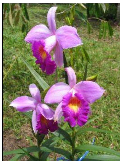
ภาพที่ 19 หญ้าจิ้มฟันควาย

ชื่ออื่น: แคมดอกขาว แคมเหลือง ง้วนตากหางย ม้วนตากหางย ห้อนตักหางย เอื้องใบไผ่ ฮ้วนตักหางย น้ำทราย ยี่โถปีนัง หญ้าแฝงสี หญ้าแยงแย้