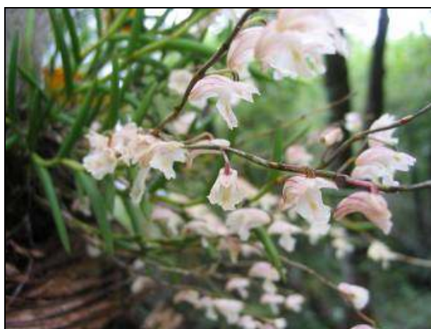
ภาพที่ 40 กล้วยไม้มีอนาง

ลักษณะทางพฤกษศาสตร์: กล้วยไม้มีอนาง เจริญทางข้าง ต้นคดไปมา ยาว 30 ซม. หรือมากกว่า ใบ เรียงสลับ รูปทรงกระบอก โค้ง ปลายแหลม เส้นผ่านศูนย์กลาง 0.4 ซม. ยาว 3–4 ซม. ช่อดอก เกิดบนส่วนยอดของต้น ดอกบานมีกลิ่นหอมอ่อน ๆ ดอก สีเขียวปนเหลืองอ่อน กว้าง 1.2 ซม. ยาว 1.2 –1.8 ซม. กลีบเลี้ยงบน รูปใบหอก ปลายมน กว้าง 0.2 ซม. ยาว 0.5 ซม. กลีบเลี้ยงคู่ข้าง ปลายมน ฐานกว้าง 0.3 ซม. ยาว 0.4 ซม. กลีบดอก รูปแถบ ปลายมน กว้าง 0.14 ซม. ยาว 0.38 ซม. ด้านหลังกลีบเลี้ยงมีเส้นสีม่วงเข้มพาดตามยาวเห็นเด่นชัด กลีบปาก ไม่มีหูกลิบบปาก ฐานโค้ง ปลายกลีบปากชี้ไปข้างหน้า กว้าง 0.5–0.7 ซม. ขอบบางเป็นริ้ว กลางกลีบเว้าบุ๋ม มีเส้นสีม่วงจาง ๆ พาดกลาง ปลายกลีบปากสีน้ำตาลเหลืองไล่โทนลงสู่ส่วนโคนจนเป็นสีเหลืองอ่อน เส้นเกสรมีคางยาว โค้งไปข้างหน้า ยาว 0.7 ซม. ยอดเกสรเพศเมียสีเขียว ฝากรอบกลุ่มอับเรณูสีขาวครีม กลุ่มอับเรณูสีเหลืองอ่อน