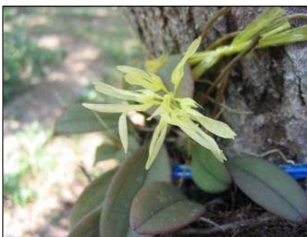
ภาพที่ 29 สิงโตถีนใต้

ลักษณะทางพฤกษศาสตร์: กล้วยไม้อิงอาศัย เจริญทางข้าง รากฝอย ต้นลักษณะเป็นเหง้า มีลำลูกกล้วยเป็นระยะ ๆ ลำลูกกล้วยขนาดเล็ก รูปไข่หรือรูปรี กว้างและยาว 1.2 ซม. เมื่อแก่จะทิ้งใบและเกิดร่อง ใบ หนาอวบน้ำ รูปขอบขนานแกมรูปไข่กลับ ปลายมน เว้าปุ่ม กว้าง 1.3–3.5 ซม. ยาว 4.8–9 ซม. ช่อดอก ออกที่ฐานลำลูกกล้วย ก้านพอมยาว ดอกเป็นกระจุก ใบประดับดอกรูปใบหอก สีม่วง ดอก สีเหลืองครีมหรือเหลืองเกือบขาว ดอกกลิ่นหอมอ่อน ๆ ดอกกว้าง 1 ซม. ยาว 1.5 ซม. กลีบเลี้ยงบน รูปหอกแกมรูปรี กว้าง 0.2 ซม. ยาว 0.5 ซม. กลีบเลี้ยงคู่ข้าง รูปขอบขนาน ปลายแหลม กว้าง 0.2 ซม. ยาว 1.3–1.9 ซม. กลีบดอก รูปใบหอก กว้าง 0.2 ซม. ยาว 0.4 ซม. ขอบหยักไม่เรียบ สีเหลืองเข้ม กว้าง 0.1 ซม. ยาว 0.2 ซม. รูปสามเหลี่ยมโค้งงอเข้า ฝาครอบกลุ่มอับเรณูสีเหลืองเข้ม ครอบกลุ่มอับเรณูสีเหลือง