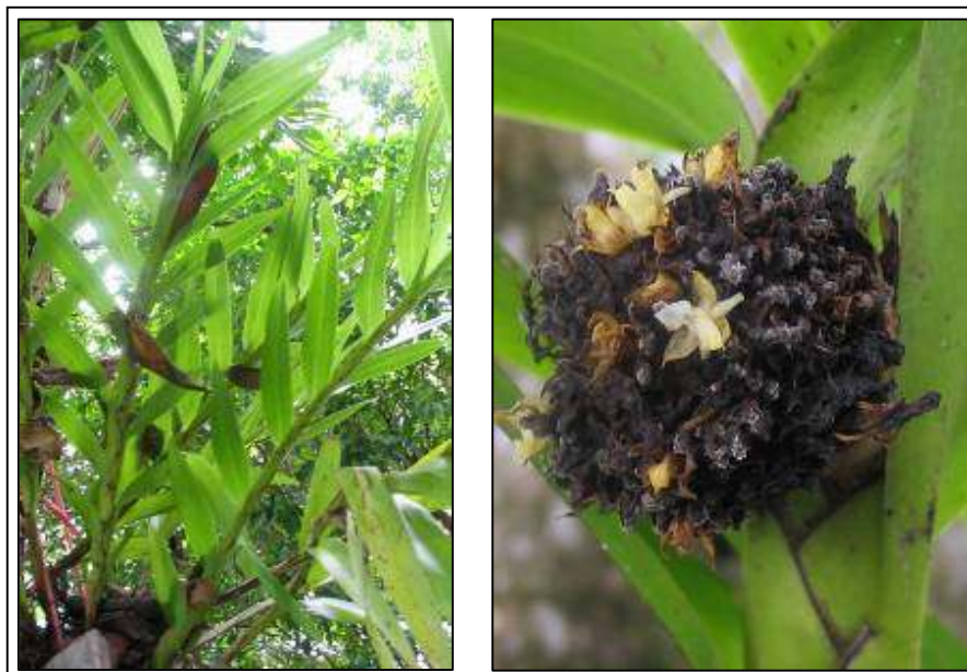
ภาพที่ 14 เอื้องปีกไก่ใหญ่

ลักษณะทางพฤกษศาสตร์: กล้ายไม้อิงอาศัย เจริญทางข้าง รากกิ่งอากาศ ต้นค่อนข้างแบนค่อย ๆ หนา และกว้างสู่ปลาย ต้นขนานกับพื้นดินหรือห้อยลง ยาวได้ถึง 100 ซม. ใบ จำนวนมากมาก เรียงสลับระนาบเดียว รูปใบหอก กว้าง 2.2–2.7 ซม. ยาว 21–32 ซม. แผ่นใบบางสีเขียวสด โคนใบเป็นกาบหุ้มต้น ช่อดอก เป็นกระจุกแน่นทรงครึ่งวงกลมที่ยอด เส้นผ่านศูนย์กลาง 3–4 ซม. ดอกในช่อบานครั้งละ 2–3 ดอก ดอก ขนาดเล็ก ก้านดอกย่อยและดอกสีขาวครีม กว้าง 0.4 ซม. ยาว 0.5 ซม. กลีบเลี้ยง รูปสามเหลี่ยม กว้าง 0.2 ซม. ยาว 0.35 ซม. กลีบเลี้ยงคู่ข้าง ขนาดใกล้เคียงกับกลีบเลี้ยงบน หลังกลีบมีสันนูน 1 สัน กลีบดอก รูปแถบขนาดเล็ก กว้าง 0.1 ซม. ยาว 0.3 ซม. กลีบปาก สีขาว ชี้ไปข้างหน้า ยาว 0.5 ซม. เส้าเกสรสั้นสีขาว