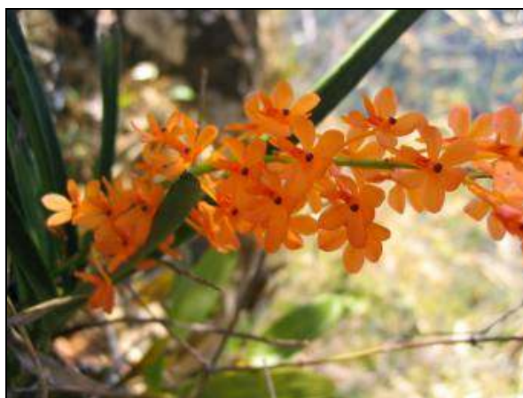
ภาพที่ 21 เอื้องเข็มแสด

ชื่ออื่น: พุ่มสุวรรณ เอื้องไขเหลือง เอื้องมันปู เอื้องเหลือง พระฝาง เอื้องช่องคำ