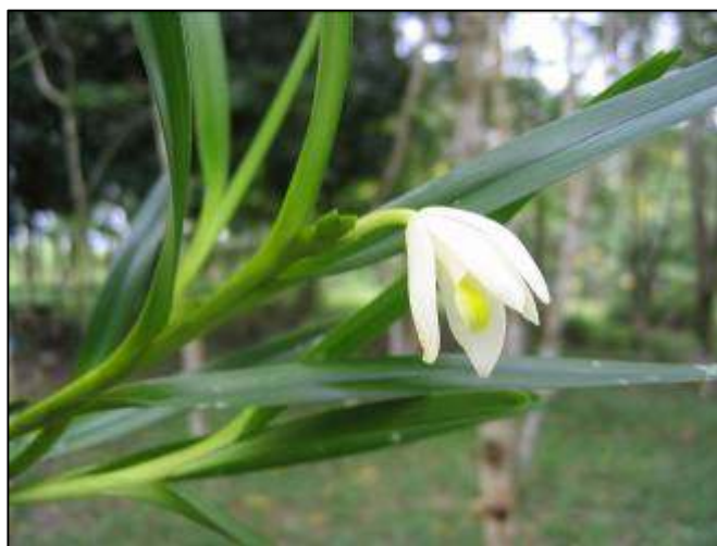
ภาพที่ 22 กลีบขาว

ลักษณะทางพฤกษศาสตร์: กล้วยไม้อิงอาศัย เจริญทางข้าง กอเป็นกระจุกแน่น รากกิ่งรากอากาศค่อนข้างใหญ่ สีน้ำตาล ต้นเป็นเหง้าทอดยาว แตกแขนง ใบ เรียงสลับ รูปขอบขนาน ปลายใบหยักเว้า ไม่เสมอกัน โคนใบเป็นกาบหุ้มรอบต้น แผ่นใบเรียบเป็นมัน กว้าง 1–2 ซม. ยาว 5.5–20 ซม. ช่อดอก ออกที่ยอด ดอก บานสีขาวครีม กว้าง 1.7 ซม. ยาว 2.5 ซม. กลีบเลี้ยงบน รูปขอบขนานแกมใบหอกกลับ ปลายกลีบแหลมจุ่ม กว้าง 0.7–0.8 ซม. ยาว 2.5–2.8 ซม. กลีบเลี้ยงคู่ข้าง กว้างและยาวน้อยกว่ากลีบเลี้ยงบนเล็กน้อย ลักษณะกลีบรูปขอบขนานแกมใบหอกกลับ ปลายเรียวแหลม ไม่สมมาตร ด้านหลังกลีบมีแถบสีเหลืองน้ำตาลพาดกลางตลอดความยาวของกลีบ กลีบดอก กว้าง 0.5–0.85 ซม. ยาว 2.3–2.5 ซม. ทั้งคู่อยู่ชิดกันโค้งไปข้างหน้า กลีบปาก สีเหลืองครีมรูปใบหอกกลับ กว้าง 0.5 ซม. ยาว 1.8 ซม. หูกลีบปากตั้งขึ้น ขอบอาจมีหรือไม่มีสีม่วง ปลายกลีบปากรูปไข่ปลายแหลม สีครีม ขอบบาง เส้นแวงยาว 1.4 ซม. ขอบส่วนโคนอาจมีหรือไม่มีสีม่วง