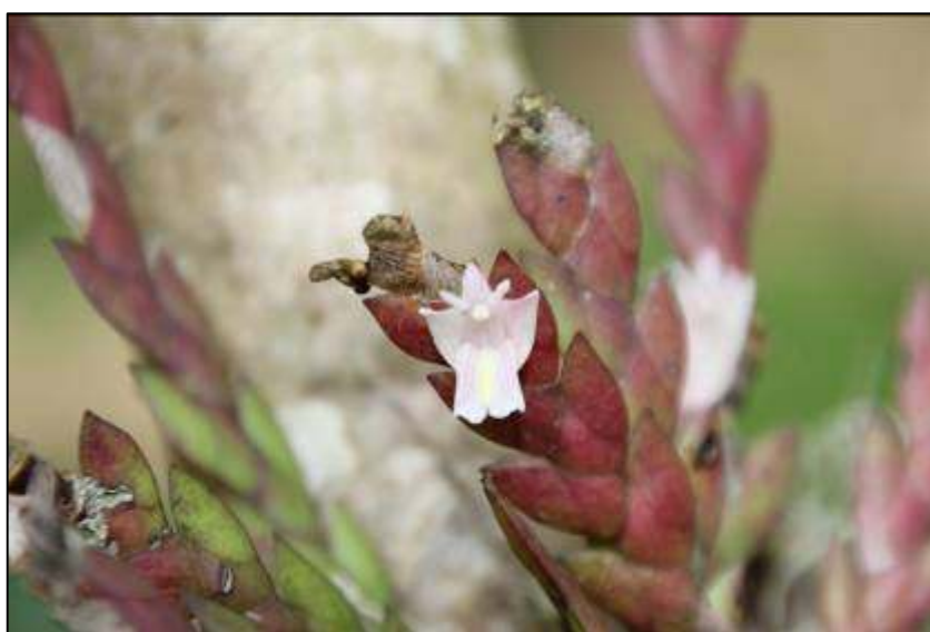
ภาพที่ 62 เอื้องแผงโสภา

ลักษณะทางพฤกษศาสตร์: กล้วยไม้อิงอาศัยขนาดเล็ก เจริญทางด้านข้าง ไม่มีลำลูกกล้วย ต้นพอมเล็ก มีโคนกาบใบหุ้มตลอด ยาว 10–12 ซม. ส่วนกว้างรวมใบทั้ง 2 ข้าง 1.5–2 ซม. ขึ้นเป็นกอ ทอดเอนหรือห้อยลง ใบ รูปใบมีด หนา อวบน้ำ กว้าง 0.5–0.7 ซม. ยาว 1–1.5 ซม. ปลายแหลม เรียงตัวทแยงชิดกันใบต่อใบ สลับซ้ายขวา สีเขียวเข้ม หรือเขียวอมน้ำตาล หรือเขียวอมม่วง ดอก เกิดที่ยอดเป็นกระจุก บานครั้งละ 1–3 ดอก กว้าง 6–7 มม. ยาว 8–10 มม. ก้านดอกยาวประมาณ 0.5 ซม. กลีบเลี้ยงและกลีบดอก มีสีขาวอมม่วง กลีบปาก รูปแถบ มีแถบสีเหลืองอ่อนพาดตามยาว ปลายกลีบเว้าแยกออกเป็น 2 แฉก มีหูปากตั้งชัน เส้าเกสรสั้น แต่โคนยืดยาว และเชื่อมกับโคนกลีบเลี้ยงคู่ข้างจนเป็นคางดอก มีฝากรอบ กลุ่มเรณูมี 4 กลุ่ม