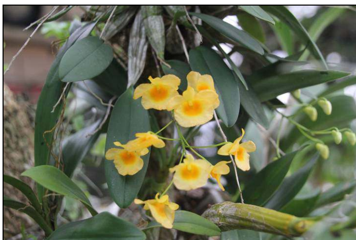
ภาพที่ 53 เอื้องผึ้ง

ลักษณะทางพฤกษศาสตร์: ลำลูกกล้วยรูปรี อ้วนสั้น กว้าง 1.5–2.5 ซม. ยาว 5–12 ซม. มีสันและร่องตามความยาว ขึ้นชิดเป็นกอ ปลายลำใบเดี่ยว ใบ รูปรี รูปรีแกมรูปขอบขนาน หรือเกือบกลม กว้าง 2–3 ซม. ยาว 6–12 ซม. ปลายใบเว้า แผ่นใบหนาและแข็ง ใบมีอายุหลายฤดู ช่อดอก มี 1–2 ช่อ ห้อยลง ก้านช่อดอกสั้นกว่าแกนช่อดอก ดอก บานใหม่สีเหลืองอมเขียว เปลี่ยนเป็นสีเหลืองเข้ม ดอกบานขนาดเส้นผ่านศูนย์กลางประมาณ 2–2.5 ซม. กลีบเลี้ยง รูปรีแกมรูปไข่ กลีบดอก รูปทรงเกือบกลม ปลายกลีบมน กลีบปาก รูปทรงเกือบกลม ใหญ่กว่ากลีบอื่น โคนกลีบสีเหลืองส้ม เส้าเกสรอ้วนสั้น ฝากรอบกลุ่มเรณูรูปกลม