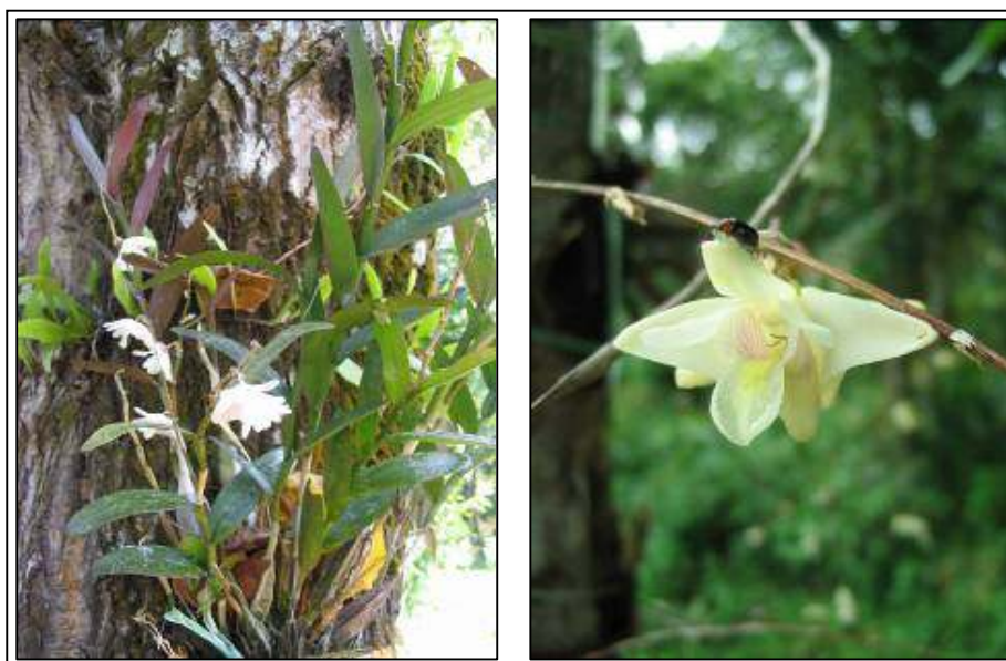
ภาพที่ 49 หวายตะมอยน้อย

ลักษณะทางพฤกษศาสตร์: กล้วยไม้อิงอาศัย เจริญทางข้าง ต้นตั้งขึ้นหรือห้อยลง ลำลูกกล้วยทรงกระสวย สีม่วง มี 2 ปล้อง ต้นเหนือลำลูกกล้วยค่อนข้างแบน ยาวได้ถึง 1 ม. ใบ เรียงสลับ รูปรี ปลายมน กว้าง 1.5–2.5 ซม. ยาว 5–8 ซม. สีม่วง ดอก ออกที่ข้อบริเวณปลายยอดของต้นที่แก่เต็มที่และทิ้งใบจนเหลือเพียง 3–5 ใบ ดอกบานกลิ่นหอม สีชมพูอ่อนหรือเหลืองอ่อน กว้าง 3 ซม. กลีบเลี้ยง ด้านนอกมีแถบสีม่วงอมแดงพาด กลีบเลี้ยงบน รูปใบหอก ปลายมน ฐานกว้าง 0.5 ซม. ยาว 0.8 ซม. กลีบเลี้ยงคู่ข้าง ฐานกว้าง 0.4 ซม. ยาว 1.1 ซม. กลีบปาก ยาว 1.5 ซม. หูกลีบปากฐานกว้าง ปลายมน โค้งเข้า มีแถบสีม่วงแดงพาด ระหว่างหูกลีบมีสัน 3 สัน โคนสันสีม่วงอ่อน ปลายสันสีเหลือง ฐานคล้ายกลุ่มเนื้อเยื่อ 3 กลุ่ม จรดโคนปลายกลีบปาก ปลายกลีบปากรูปเกือบกลม สีขาว พับลง กว้างและยาว 0.7 ซม. ขอบหยักเป็นริ้ว ปลายเว้าบุ๋ม คางยาว 1.3 ซม. เส้าเกสรสีขาว