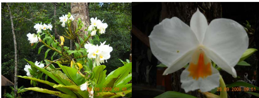
ภาพที่ 48 เอื้องเงินหลวง

ลักษณะทางพฤกษศาสตร์: กล้วยไม้อิงอาศัย เจริญทางด้านข้าง ลำลูกกล้วยเป็นแท่งกลม ยาว 20-40 ซม. ผิวลำมีขนสั้น สีดำ ใบ รูปรีแกมรูปขอบขนาน กว้าง 2.5-3 ซม. ยาว 7-10 ซม. ดอก สีขาว ออกเป็นช่อสั้นใกล้ปลายยอด แต่ละช่อมี 1-7 ดอก มีกลิ่นหอมอ่อนๆ บานไม่พร้อมกัน ดอกบานกว้าง 5-6 ซม. กลีบเลี้ยง รูปหอกแกมรูปรี ปลายกลีบแหลมเป็นติ่ง กลีบดอก รูปไข่กลับ ปลายกลีบมน มีติ่งแหลม กลีบปาก สีขาว มีแถบสีเหลืองพาดจากโคนกลีบจนถึงกึ่งกลางกลีบ หูกลีบปากฐานกว้าง ชีตั้งขึ้น ปลายทั้งสองโค้งเข้าขอบกลีบเรียบแต่บิดเป็นคลื่น