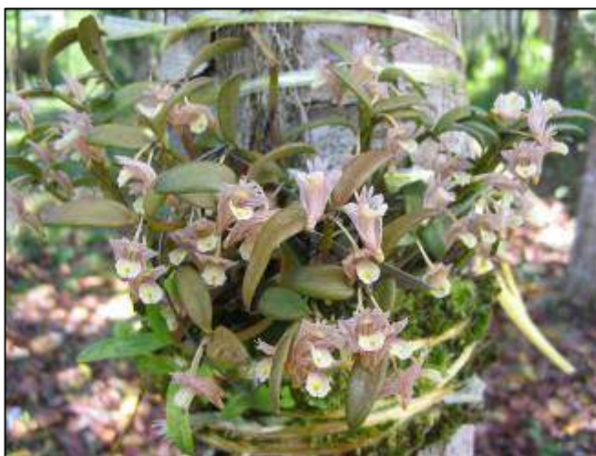
ภาพที่ 58 เอื้องน้อย

ลักษณะทางพฤกษศาสตร์: กล้วยไม้อิงอาศัยขนาดเล็ก เจริญทางข้าง รากฝอย ลำลูกกล้วยรูปกระสวย หรือรูปรี กว้าง 0.6–0.8 ซม. ยาว 2–5 ซม. ผิวเป็นสันและร่องตื้นๆตามยาว ใบ เกิดที่ยอด มี 2 ใบ รูปรี กว้าง 0.6–0.7 ซม. ยาว 1.5–3 ซม. แผ่นใบหนา มีร่องตื้นๆกลางใบ ช่อดอก ออกที่ยอด มี 1–2 ดอก กว้าง 1 ซม. ยาว 1.2–1.5 ซม. ก้านดอกย่อยเล็กมาก ดอกสีขาว มีแถบสีม่วงพาด พบได้ยากที่ ดอกมีสีขาวเกลี้ยง กลีบเลี้ยงบน ยาว 0.45 ซม. คางยาว 0.8–1.1 ซม. กลีบเลี้ยงคู่ข้าง เชื่อมติดกัน เป็นถุง กลีบปาก ยาว 1 ซม. โคนเรียวแหลม กลางกลีบค่อนข้างไปทางปลายมีกลุ่มเนื้อเยื่อขนาดเล็กสี เหลือง หรือสีออกเขียว ผนังของฐานคางภายในมีต่อมน้ำหวาน ดอกบานมีกลิ่นหอม บานประมาณครึ่ง วัน