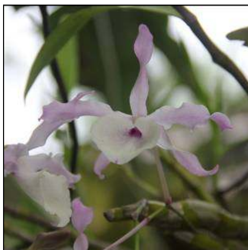
ภาพที่ 63 เอื้องตอติเล

ชื่ออื่น: เอื้องไม้ตั้ง เอื้องตีนนก เอื้องเค้กกัว