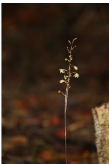
ภาพที่ 65 กล้วยปลวก