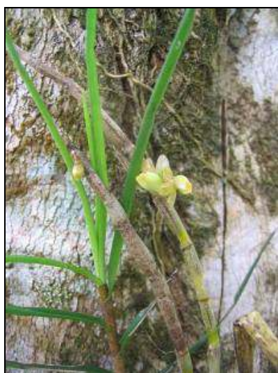
ภาพที่ 57 เอื้องขนหมู

ลักษณะทางพฤกษศาสตร์: กล้วยไม้อิงอาศัยหรือขึ้นบนหิน เจริญทางข้าง โคนลำลูกกล้วยอยู่ชิดติดกัน รูปทรงกระบอกสีเหลือง ยาวได้ถึง 50 ซม. ทั้งกาบใบและลำลูกกล้วยปกคลุมด้วยขนสีน้ำตาลดำ ใบเรียงสลับ คล้ายใบหญ้า กว้างได้ถึง 2.5 ซม. ยาว 10 ซม. ปลายใบเรียวแหลม ช่อดอก ออกที่ข้อ มีดอก 1 คู่ ดอก กว้าง 0.9 ซม. สีเขียวอ่อนถึงสีชมพูอ่อน พาดด้วยแถบสีน้ำตาลอมส้มหรือม่วงเข้ม ตลอดความยาว ก้านดอกย่อยสีน้ำตาลอมเขียว กลีบเลี้ยงบน รูปรี กว้าง 0.3 ซม. ยาว 0.4 ซม. กลีบเลี้ยงคู่ข้าง กางออก ฐานกว้าง 0.3 ซม. ยาว 0.4 ซม. กลีบดอกรูปแถบ ชี้ขึ้น กว้าง 0.1 ซม. ยาว 0.4 ซม. กลีบปาก สีเขียวอมเหลืองอ่อนแนบติดกับเส้าเกสร หูกลีบปากขนาดเล็กรูปสามเหลี่ยมปลายมน สีน้ำตาลอ่อนอมส้ม ตรงกลางมีสันนูน 2 สัน พาดจากฐานกลีบปากถึงฐานปลายกลีบปาก ปลายกลีบปากนูนขึ้น สีน้ำตาลอมส้มอ่อนตรงกลางไว้บุม เส้าเกสรสีขาว ฝากรอบกลุ่มอับริณสีขาว