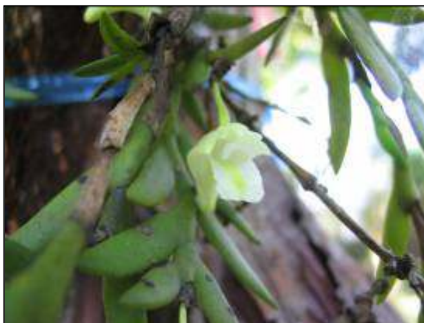
ภาพที่ 55 เอื้องก้างปลาเล็ก

ลักษณะทางพฤกษศาสตร์: กล้วยไม้อิงอาศัย เจริญทางข้าง กอเป็นกระจุก ต้นยาว 15 ซม. ใบเรียงสลับ รูปคล้ายใบมีด กว้าง 0.8 ซม. ยาว 2–2.5 ซม. แผ่นใบอวบน้ำ หนา ปลายใบแหลม ดอก ออกที่ปลายยอดของต้นที่ยังมีใบ หรือข้อของต้นที่ทิ้งใบแล้ว แต่ละซ่อมี 1–3 ดอก ก้านดอกย่อยสีเขียวอมเหลือง มีแถบสีม่วงแต้ม ดอกสีเขียวอ่อนแกมเหลือง ด้านนอกกลีบเลี้ยงมีแถบสีม่วงพาด ดอกบานกลิ่นหอม กว้าง 1.5 ซม. ยาว 2.1 ซม. กลีบเลี้ยงบน รูปใบหอก กว้าง 0.3 ซม. ยาว 0.8 ซม. กลีบเลี้ยงคู่ข้าง ฐานกว้าง 0.5 ซม. ยาว 0.6 ซม. กลีบดอก บาง รูปขอบขนาน กว้าง 0.2 ซม. ยาว 0.7 ซม. คางโค้งใบข้างหน้า ยาว 1.5 ซม. กลีบปาก รูปพัด ปลายโค้งลง กว้าง 0.9 ซม. ไม่มีหูกลิบ ตรงกลางหยักเว้า มีตุ่มเล็ก ๆ สีเหลืองอยู่ตรงกลาง เส้นประสาทสีขาว ไม้ยืนตัว ฝากรอบกลุ่มอันเรณูสีขาวบางใส