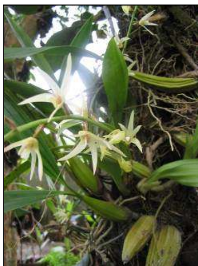
ภาพที่ 69 เสวตสุกรี

ลักษณะทางพฤกษศาสตร์: กล้วยไม้อิงอาศัย เจริญทางด้านข้าง ต้นขึ้นชิดเป็นกอ ลำลูกกล้วยรูปไข่ เป็นสันเหมือนผลวบ กว้าง 2–2.5 ซม. ยาว 3–5 ซม. มีโคนกาบใบคลุมตลอด ใบ ขนาดใหญ่ มี 2 ใบ รูปรีแกมรูปขอบขนาน กว้าง 3–4 ซม. ยาว 20–25 ซม. แผ่นใบค่อนข้างบางและอ่อน มีแนวพับ จีบตามยาว ใบอื่นๆขนาดเล็ก หรือลดรูปเหลือคล้ายกาบใบ ช่อดอก เกิดใกล้ยอด เป็นช่อตรงหรือโค้ง ทอดเอน หรือห้อยลง ยาว 20–30 ซม. ดอกในช่อโปร่ง เรียงเวียน กระจายเป็นระยะๆจากโคนไปถึงปลายช่อ บานจากโคนสู่ปลายช่อ กลีบเลี้ยงและกลีบดอก สีขาว แยกเป็นอิสระ ก้านดอกยาว 1–5 ซม. ขนาดดอก 3–4 ซม. กลีบปาก อาจมีขีดหรือแถบสีม่วงแดง กลิ่นหอมอ่อน ๆ กลุ่มเรณูมี 8 อัน แยกเป็น 2 ชุด ชุดละ 4 อัน ไม่มีก้านและแป้นก้านกลุ่มเรณู