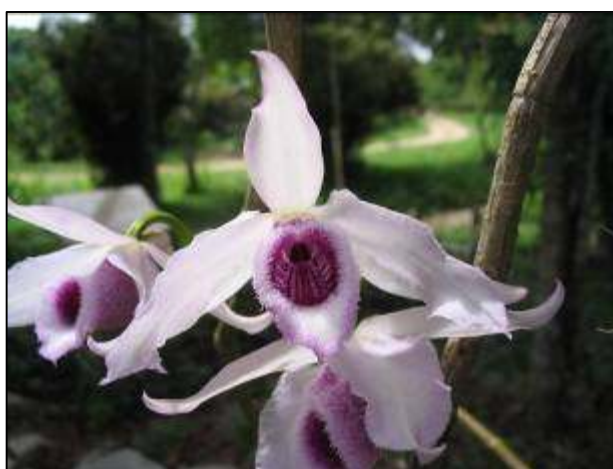
ภาพที่ 42 เอื้องสายหลวง

ลักษณะทางพฤกษศาสตร์: กล้วยไม้อิงอาศัยเจริญทางข้าง รากกิ่งรากอากาศ กอโปร่ง ลำลูกกล้วยยาวถึง 120 ซม. ห้อยลงเป็นสายยาว ใบ รูปรีแกมขอบขนาน ปลายใบแหลม ช่อดอก ออกที่ข้อทุกข้อ ค่อนข้างไปทางปลายของลำลูกกล้วย แต่ละช่อมี 1–2 ดอก ดอกสีม่วงอ่อนถึงม่วงเข้ม ดอกมีกลิ่นหอม เส้นผ่านศูนย์กลางดอก 4–10 ซม. กลีบเลี้ยง รูปหอกแกมรูปรี กว้าง 1.3 ซม. ยาว 3.1 ซม. กลีบดอก รูปหอก สีเข้มกว่ากลีบเลี้ยง กว้าง 2 ซม. ยาว 3.4–6 ซม. ขอบกลีบหยักเป็นริ้วละเอียด กลีบปาก รูปกลมปลายแหลม ขอบกลีบไม่มีหู ขอบกลีบม้วนเข้าหากันจนมองดูคล้ายหลอด (สายพันธุ์ทางภาคตะวันออกเฉียงเหนือขอบแผ่อกไม่ม้วนเข้าหากัน) ตรงกลางแต้มด้วยสีม่วงเข้มทั้งสองด้าน ฐานเป็นแถบสีม่วง ปลายกลีบยื่นแหลมออกมาอาจมากหรือน้อย ผิวกลีบด้านในมีขนสีม่วงอ่อนปกคลุม ด้านนอกมีขนเฉพาะบริเวณขอบกลีบ ฝาครอบกลุ่มอับเรณูสีม่วงเข้ม