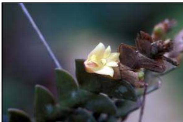
ภาพที่ 52 เอื้องตะขาบใหญ่

ลักษณะทางพฤกษศาสตร์: กล้ายไม้อิงอาศัย เจริญทางข้าง รากฝอย ต้นเล็กและแบนคดไปมา ยาวได้ถึง 25 ซม. ใบ คล้ายรูปใบมีด เรียงสลับหุ้มตลอดต้น สีเขียวเข้ม แผ่นใบอวบน้ำ หนา 0.2 ซม. ฐานกว้าง 0.8 ซม. ยาว 1 ซม. ดอก ออกที่ปลายยอด ครั้งละ 1–2 ดอก กลิ่นหอมมาก ก้านดอกสั้นมีกาบหุ้ม ดอกกว้าง 1.3 ซม. ยาว 1.8 ซม. กลีบเลี้ยงบน รูปไข่ กว้าง 0.5 ซม. ยาว 0.8 ซม. กลีบเลี้ยงคู่ข้าง ขนาดใกล้เคียงกับกลีบเลี้ยงบน ทั้งกลีบดอกและกลีบเลี้ยงด้านในสีเขียวครีม ด้านนอกสีม่วง กลีบดอก บาง รูปไข่ กว้าง 0.4 ซม. ยาว 0.6 ซม. สีเขียวครีม กลีบปาก ยื่นยาว โค้ง ด้านนอกสีม่วง ด้านในสีเหลือง หูกลีบปากมีสีม่วงเป็นแถบแต้ม กลางกลีบปากมีแต้มรูปกลมสีม่วง ปลายกลีบปากมีกลุ่มเนื้อเยื่อสีเขียวครีมอยู่ทั้งสองข้าง เส้าเกสรไม่ยื่น ฝากรอบกลุ่มอับเรณูสีเหลือง