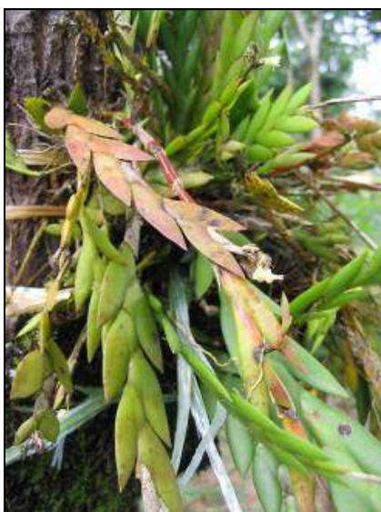
ภาพที่ 41 เอื้องมณี

ลักษณะทางพฤกษศาสตร์: กล้วยไม้อิงอาศัย เจริญทางช้าง รากฝอย ต้นไม่มีลำลูกกล้วย ต้นแบน ยาวได้ถึง 45 ซม. ใบ เรียงสลับอยู่ชิดกัน รูปคล้ายใบมีด ปลายใบแหลม กว้าง 0.7 ซม. ยาว 2.5 ซม. ใบบริเวณกลางต้นจะใหญ่ที่สุด บางต้นใบจะมีสีออกแดง ช่อดอก ออกบริเวณปลายยอดหรือซอกใบ หรือตรงข้อที่ใบร่วงหล่นแล้ว ดอก มักบานทีละดอก สีขาวครีม กว้างและยาว 0.4 ซม. กลีบเลี้ยงบนและกลีบเลี้ยงคู่ข้าง กว้าง 0.1 ซม. ยาว 0.2 ซม. กลีบดอก กว้างน้อยกว่ากลีบเลี้ยงแต่ความยาวใกล้เคียงกัน ทั้งกลีบดอกและกลีบเลี้ยง จะม้วนตัวไปทางด้านหลัง กลีบปากบาง ยื่นไปข้างหน้า ยาว 0.3 ซม. หูกลีบปากตั้งขึ้นปลายโค้งเข้า ปลายกลีบปากเว้าบวม เส้นเกสรยื่นตัวออกมาประมาณ 0.1 ซม. ฝักครอบอับเรณูสีขาวครีม