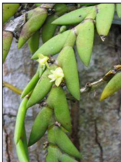
ภาพที่ 51 เอื้องก้างปลา

ลักษณะทางพฤกษศาสตร์: กล้วยไม้อิงอาศัย เจริญทางข้าง กอเป็นกระจุก ต้นแบนและโค้งห้อยลง ยาว 30–50 ซม. โคนต้นทิ้งใบ ใบ เรียงสลับ ระบายเดี่ยว รูปคล้ายใบมีด ส่วนกว้างรวมใบทั้งสองข้าง 2.4 ซม. ใบกว้าง 0.6 ซม. ความยาววัดจากขอบด้านนอกของใบ 3.5–4 ซม. ช่อดอก ออกที่ข้อตรงข้ามใบ มีกาบแห้งหุ้ม ดอกในช่อบานครั้งละ 1–2 ดอก ดอก สีเหลืองอมเขียว กว้าง 0.6 ซม. ยาว 0.45 ซม. หลังกลีบเลี้ยงมีสีม่วงแดงแต้ม กลีบเลี้ยงบนรูปรี กว้าง 0.15 ซม. ยาว 0.25 ซม. กลีบเลี้ยงคู่ข้าง กางออกข้าง กว้างและยาว 0.25 ซม. กลีบดอก รูปรีแกมขอบขนาน กว้างประมาณ 0.1 ซม. ยาว 0.2 ซม. กลีบปาก ชี้ขึ้น ส่วนโคนกว้าง 0.1 ซม. ส่วนปลายกลีบปากพับลง กว้าง 0.3 ซม. ยาว 0.35 ซม. บริเวณกลางกลีบปากมีรยางค์ยื่นตัวชี้ขึ้น หูกลีบปากมีแถบสีม่วงแดงพาดข้างละ 2 แถบ เส้าเกสรสั้น ฝากรอบกลุ่มอัปเรณูเว้าบุ๋มลงเป็นหลุมตื้น ๆ ภายในหลุมสีม่วงแดงจาง ๆ