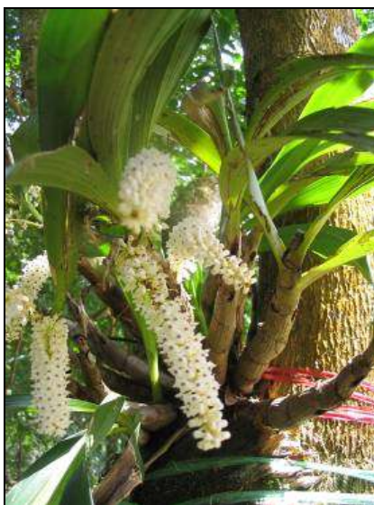
ภาพที่ 67 เอื้องช่องวงช้าง

ลักษณะทางพฤกษศาสตร์: กล้ายไม้อิงอาศัย เจริญทางช้าง ขนาดใหญ่ กอเป็นกระจุก รากกิ่งอากาศ ลำลูกกล้ายอวบน้ำ รูปทรงกระบอกแบนเล็กน้อย เส้นผ่านศูนย์กลาง 2–3 ซม. ยาวได้ถึง 30 ซม. ใบรูปขอบขนานแกมใบหอก 3–6 ใบ กว้าง 4–5 ซม. ยาวได้ถึง 35 ซม. ปลายใบเรียวแหลม โคนใบเป็นกาบขนาดใหญ่ ช่อดอก ออกตรงข้ามใบ 2–3 ช่อ ในแนวระนาบ ปลายช่อโค้งลง ยาว 10–17 ซม. ดอกบานทน หยอยบานจากโคนสู่ปลายช่อ กลิ่นหอม ใบประดับดอกสีเหลืองอมน้ำตาลอ่อน รูปไข่ พับกลับ ดอก กว้างและยาว 0.8 ซม. สีขาว หรือชมพูอ่อน กลีบเลี้ยงบน รูปไข่ กว้าง 0.3 ซม. ยาว 0.5 ซม. กลีบเลี้ยงคู่ข้าง ฐานกว้างกว่าเล็กน้อย กลีบดอก รูปรีแกมขอบขนาน กว้าง 0.2 ซม. ยาว 0.4 ซม. กลีบปาก รูปรางคล้ายพัด กว้าง 0.3 ซม. ยาว 0.4 ซม. หูกลีบปากเรียวแหลม อยู่ลึกแนบติดฐานเส้าเกสรด้านล่าง ยอดเกสรเพศเมียและฝากรอบกลุ่มอับเรณูสีม่วงอมแดง