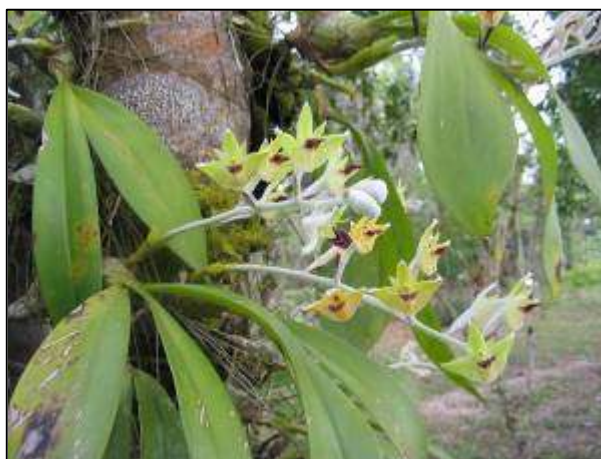
ภาพที่ 70 เอื้องบายศรี

ลักษณะทางพฤกษศาสตร์: กล้ายไม้อิงอาศัย เจริญทางข้าง รากฝอย เหนียว แข็ง ต้นเป็นเหง้าแข็ง ทอดยาว ลำลูกกล้วยรูปไข่เบี้ยวแบนเล็กน้อย กว้าง 2–4 ซม. ยาว 5–7 ซม. แต่ละลำลูกกล้วยจะมี 3–4 ใบ ใบ เรียงสลับ รูปใบหอกกลับแกมรูปไข่ หรือรูปขอบขนาน ปลายใบแหลม โคนใบเป็นกาบหุ้ม รอบลำลูกกล้วย แผ่นใบหนาโค้ง กว้าง 2–5 ซม. ยาว 20–30 ซม. ช่อดอก แบบช่อกระจุก ยาว 15–30 ซม. ดอก มีกลิ่นฉุน กว้าง 2.8 ซม. ยาว 2.4 ซม. กลีบเลี้ยงบน สีเขียวอ่อน รูปใบหอก ปลายมน กว้าง 0.6 ซม. ยาว 1.6 ซม. กลีบเลี้ยงคู่ข้าง ด้านในตรงบริเวณปลายคางมีสีม่วงแต้ม ทางด้านนอกมีขนสั้นนุ่มสีขาวปกคลุม กลีบดอก รูปใบหอก สีเขียวอ่อน กว้าง 0.3 ซม. ยาว 1.2 ซม. ทั้งกลีบดอก และกลีบเลี้ยงเมื่อแก่จะเปลี่ยนเป็นสีเขียวออกเหลือง คางยาว 0.5 ซม. กลีบปาก รูปช้อนหนา เคลื่อนไหวได้ ยาว 1.5 ซม. กลีบปากส่วนโคนสีขาว หูกลีบปากสีขาวหรือม่วง ปลายกลีบปากรูปครึ่งวงกลม สีม่วง ขอบไม่เรียบ ปลายเว้าบวม กลางปลายกลีบปากมีสันนูนสีขาวรูปตัววี