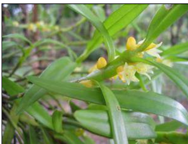
ภาพที่ 66 อินจัน

ลักษณะทางพฤกษศาสตร์: กิ่งย้อยไม่อิงอาศัย เจริญทางข้าง กอโปร่ง โคนเป็นกระจุกแน่น รากกิ่งอากาศ กลมตรงโคนแบนและกว้างออกตรงปลาย ใบ เรียงสลับที่ยอด มี 3–5 ใบ รูปขอบขนานแกมรูปรี กว้าง 1.3–1.8 ซม. ปลายใบหยักเว้าไม่เสมอกัน ช่อดอก ออกตรงข้อ ดอกในช่อมี 1 คู่ หันคางเข้าหากัน ดอก สีเหลืองอ่อน กลิ่นหอม กว้าง 0.8 ซม. กลีบเลี้ยงบน รูปสามเหลี่ยม ปลายมนฐาน กว้าง 0.3 ซม. ยาว 0.7 ซม. กลีบเลี้ยงคู่ข้าง โค้งไปข้างหน้ามีขนาดใหญ่กว่ากลีบเลี้ยงบนเล็กน้อย กลีบดอก รูปแถบ ปลายมน สีเหลืองอ่อน กว้าง 0.2 ซม. ยาว 0.65 ซม. กลีบปาก โค้ง โคนกลีบติดกับส่วนฐานเส้าเกสรคล้ายบานพับ ยาว 0.4 ซม. ไม่มีหูกลิบแต่มีขนละเอียดที่ขอบกลีบ บนกลีบมีสันหนาเรียบ 2 สัน พาดจากโคนกลีบปากสู่ฐานปลายกลีบปากและมีขนละเอียดปกคลุม ปลายกลีบปากแหลม กลางกลีบมีสันสั้น ๆ 1 สัน เส้าเกสรสั้น