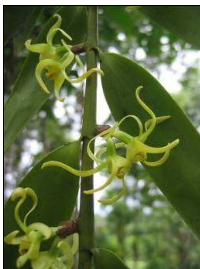
ภาพที่ 59 หวาย

ลักษณะทางพฤกษศาสตร์: กล้วยไม้อิงอาศัย เจริญทางข้าง กอโปร่ง รากกิ่งอากาศ ไม่มีลำลูกกล้วย ต้นพอม ห้อยลง ยาว 120–150 ซม. ใบ เรียงสลับ รูปใบหอก กว้าง 2.25 ซม. ยาว 12.5 ซม. ปลายใบเว้าบวมไม่เสมอกัน โคนใบเป็นกาบหุ้มต้น แผ่นใบบางและบิดตัว ช่อดอก ออกที่ข้อตรงข้ามใบ มีหลายเกือบตลอดความยาวของต้น แต่ละช่อมี 2 ดอก บานพร้อมกันทุกช่อ โดยจะหันคางสัมพันธ์กัน มีกลิ่นหอมแรง ดอกสีเหลืองอ่อน โคนกลีบสีเหลืองอมเขียวอ่อน ดอกกว้าง 1.7 ซม. ยาว 2.5 ซม. กลีบเลี้ยงบน รูปขอบขนาน ปลายเรียวแหลม โค้งงอน เป็นรูปตัว S กว้าง 0.25 ซม. ยาว 2 ซม. กลีบเลี้ยงคู่ข้าง ไม่สมมาตรโค้งตัวมาด้านหน้าเป็นรูปเคียว ฐานกว้าง 0.5 ซม. ยาว 1.8 ซม. ฐานด้านล่างเชื่อมกันด้านหลังของคาง กลีบดอก รูปแถบ โค้งกลับขึ้น ฐานกว้าง 0.15 ซม. ยาว 1.9 ซม. กลีบปาก เล็ก ยาว 0.8 ซม. ผิวด้านบนย่นขรุขระ ตรงกลางนูนคล้ายสันสี่เหลี่ยมแดงพาดจากฐานกลีบปาก จนถึงกลางปลายกลีบปาก หูกลีบปากตั้งขึ้น ปลายรูปสามเหลี่ยมเกือบแหลม ปลายกลีบปากรูปสามเหลี่ยม ม้วนลง ขอบไม่เรียบ เส้นประสาทสีขาว