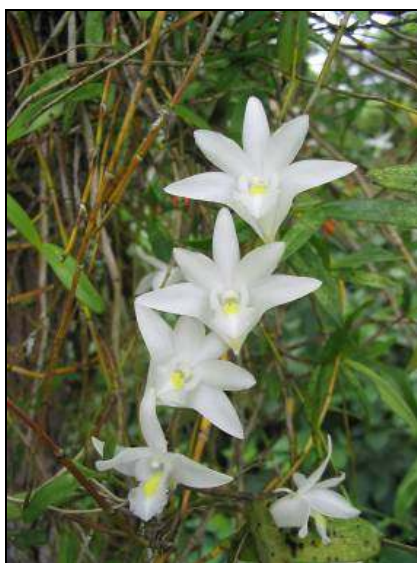
ภาพที่ 47 เอื้องมะลิ

ชื่ออื่น: นกกระยาง บวบกกลางหวา แส้พระอินทร์ หวายตะมอย