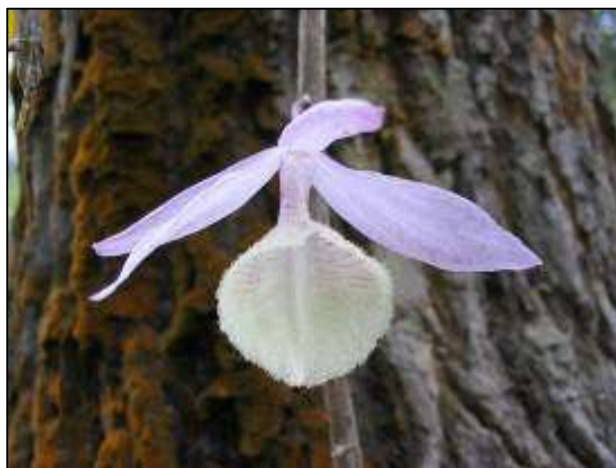
ภาพที่ 43 เอื้องสาย

ชื่ออื่น: มอกคำเครือ เอื้องย้อยไม้ เอื้องไข่นา เอื้องวงช้าง เอื้องล่องแล่ง