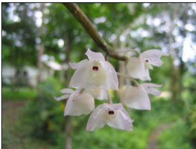
ภาพที่ 54 เอื้องดอกมะเขือใต้

ลักษณะทางพฤกษศาสตร์: กล้วยไม้อิงอาศัย เจริญทางข้าง รากกิ่งรากอากาศ ต้นพอม สีเขียวหรือม่วงน้ำตาล ห้อยลง ยาวได้ถึง 2 ม. ใบ เรียงสลับ รูปใบหอก กว้าง 1.8 ซม. ยาว 8.3 ซม. แผ่นใบบางเรียบ ช่อดอก เกิดที่ข้อค่อนไปทางปลายของต้นที่ทิ้งใบจนหมด ช่อดอกมี 1–2 ช่อ ดอกในช่อรวมกันเป็นกระจุก มีตั้งแต่ 1–6 ดอก ดอก มีกลิ่นหอม สีของดอกมีตั้งแต่ขาวถึงชมพูอมม่วงอ่อน กลีบเลี้ยงบน รูปไข่ปลายแหลม กว้าง 0.6 ซม. ยาว 1.1 ซม. กลีบเลี้ยงคู่ข้าง ไม่สมมาตร โคนกว้าง กลีบดอก รูปไข่กลับ กว้าง 0.4 ซม. ยาว 1 ซม. กลีบปาก สีขาว บางใส กลีบปากช่วงโคนคอดเข้า บาง ขอบเรียบ กว้าง 0.3 ซม. ยาว 2.5 ซม. กลีบปากช่วงปลายกลม ขอบโค้งขึ้น มีขนนุ่มสีขาวขึ้นประปราย กลางกลีบมีตุ่มเนื้อเยื่อสีใสผิวเรียบ นูน ด้านที่ติดกับกลีบปากช่วงโคนยื่นตัวเป็นรยางค์แหลม มีขนนุ่มสีขาวขึ้นล้อมรอบแน่น ฝาครอบกลุ่มอับเรณูสีม่วงเข้ม