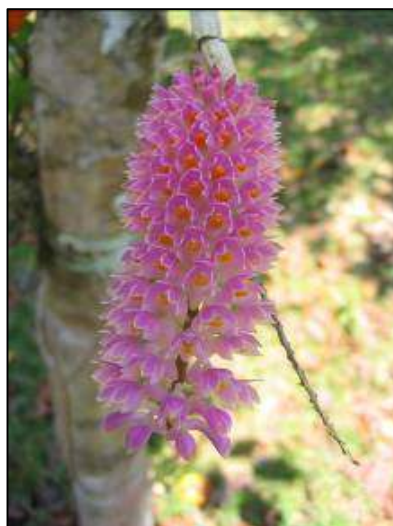
ภาพที่ 60 เอื้องแปรงสีฟัน

ชื่ออื่น: กีบแกะ คองเห่า เอื้องสีฟัน เอื้องหงอนไก่