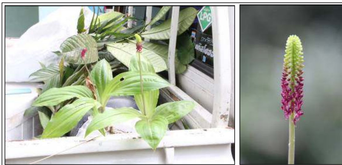
ภาพที่ 64 สิกุนคล

ลักษณะทางพฤกษศาสตร์: กล้ายไม้ดิน เจริญทางข้าง ต้นอวบน้ำ แต่ละต้นมี 4–7 ใบ ใบ เรียงเวียนสลับ รูปรีแกมหอกกลับ กว้าง 3–7 ซม. ยาว 10–20 ซม. ปลายใบเรียวแหลม แผ่นใบบาง มีรอยพับจีบตามยาว โคนใบเป็นกาบหุ้มต้น สีม่วง ช่อดอก ออกที่ยอด ยาวได้ถึง 25 ซม. ดอกในช่อแน่น เกิดจากกลางช่อขึ้นไป ดอกทยอยบานจากโคนสู่ปลาย ใบประดับเรียวแหลม ดอก สีม่วงสด กว้าง 0.4 ซม. ยาว 0.6 ซม. กลีบเลี้ยงบน รูปไข่กลับแกมขอบขนาน กว้าง 0.1 ซม. ยาว 0.3 ซม. โค้งไปข้างหน้า กลีบเลี้ยงคู่ข้าง รูปรี กว้าง 0.2 ซม. ยาว 0.3 ซม. โค้งลงแนบติดกับกลีบปาก กลางกลีบเป็นร่องตลอดความยาวกลีบ กลีบดอก รูปแถบแกมออกข้าง กว้างไม่ถึง 0.1 ซม. ยาว 0.3 ซม. กลีบปาก สีม่วงเข้ม กว้างและยาว 0.2 ซม. หูกลีบปากห่อตัวตั้งขึ้น กลางกลีบขรุขระ ปลายกลีบเป็นติ่งมน ฐานติ่งหนาสีม่วงอ่อน เส้นแวงสีม่วงเข้ม ฝาครอบกลุ่มอับเรณูสีขาว กลุ่มอับเรณูสี่เหลี่ยม