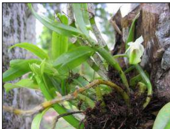
ภาพที่ 56 ข้าวตอกปราจีน

ลักษณะทางพฤกษศาสตร์: ก้านใบอิงอาศัยขนาดเล็กลง เจริญทางข้าง กอเป็นกระจุก รากกิ่งอากาศ ลำลูกกล้วยเป็นแท่งกลม เรียว อวบน้ำ สีเขียว ยาวได้ถึง 10 ซม. ใบ เรียงสลับ รูปรีแกมขนาน สีเขียว สด กว้าง 0.7–1 ซม. ยาว 2.3–5 ซม. แผ่นใบโค้ง ปลายใบหยักลึกไม่เสมอกัน โคนใบเป็นกาบหุ้มต้น ดอก ออกที่ข้อตรงข้ามแผ่นใบที่ยังไม่ร่วง มีเพียง 1 ดอก ใบประดับดอกสีขาว ดอกกว้าง 1.3 ซม. ยาว 2 ซม. ดอกสีขาว ปลายกลีบสีเขียวอ่อน กลีบเลี้ยงบน รูปขอบขนาน ปลายเรียวแหลม กว้าง 0.45 ซม. ยาว 1 ซม. กลีบเลี้ยงคู่ข้าง ไม่สมมาตร ขนาดใกล้เคียงกับกลีบเลี้ยงบน กลีบดอก รูปรี กว้าง 0.3 ซม. ยาว 0.9 ซม. กลีบปาก ขนาดใหญ่ รูปคล้ายไวโอลิน กว้าง 1.5 ซม. ยาว 2 ซม. กลางกลีบปาก ช่วงโคน แต้มด้วยสีม่วง หูกลีบปากสีขาวครีมปลายมน มีเส้นสีขาวขนาดขวางมองเห็นชัดเจน กลาง ปลายกลีบปากหยักลึกและงอนลง เส้นสีขาวสั้นกว่ากลีบปากมาก ฝากรอบกลุ่มอับเรณูสีขาว จะงอยแหลมสีขาว ยื่นไปข้างหน้า ผนังเส้นเกสรด้านในแต้มด้วยจุดสีม่วง