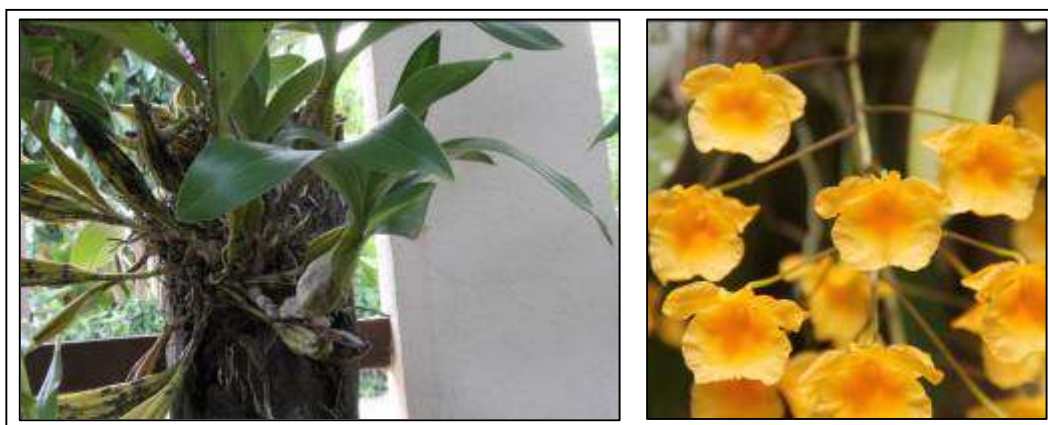
ภาพที่ 45 เอื้องคำ

ลักษณะทางพฤกษศาสตร์: กล้วยไม้อิงอาศัย เจริญทางด้านข้าง ลำลูกกล้วยรูปกระสวย เส้นผ่านศูนย์กลาง 2–3 ซม. ยาว 15–40 ซม. กลางลำอ้วนกว่าโคนและปลาย มีร่องตามยาว ขึ้นชิดกันเป็นกอ ใบ รูปขอบขนานถึงรูปหอก กว้าง 2.5–4 ซม. ยาว 8–12 ซม. ปลายเว้า โคนใบเป็นกาบ ใบค่อนข้างหนา เป็นมัน มีอายุหลายฤดูก่อนหลุดร่วงที่ข้อต่อ ช่อดอก ออกที่ข้อส่วนปลายลำ มี 1–2 ช่อ ดอกเรียงตัวเวียนรอบแกนช่อ ดอก ขนาด 2.5–3 ซม. มีกลิ่นหอมอ่อน ๆ กลีบเลี้ยง รูปขอบขนาน กลีบดอก รูปรีกว้างแกมรูปไข่กลับ ทั้งห้ากลีบสีเหลือง ปลายมน กลีบปาก รูปทรงเกือบกลม สีเหลือง โคนกลีบมีสีเหลืองอมน้ำตาลเป็นวง แผ่นกลีบด้านบนเป็นขนละเอียด ขอบกลีบหยักชายครุย เส้นเกสรสั้น