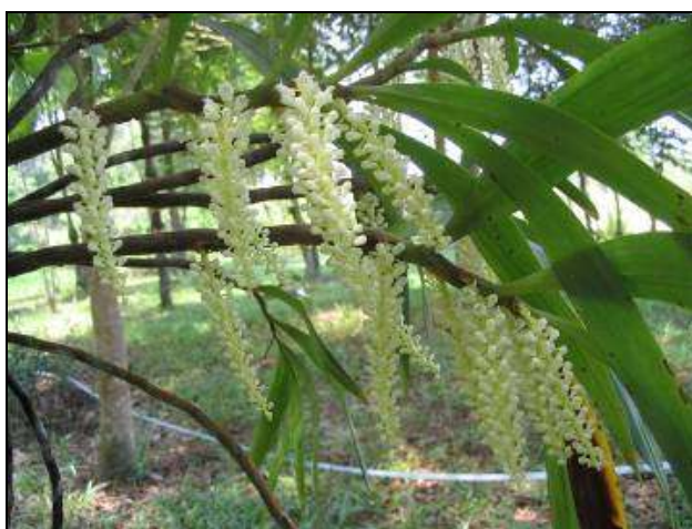
ภาพที่ 68 Eria floribunda

ลักษณะทางพฤกษศาสตร์: กล้ายไม้อิงอาศัย เจริญทางข้าง รากฝอย ต้นเป็นลำลูกกล้วยทรงกระบอก สีน้ำตาลแดง ยาว 30 ซม. หรือมากกว่า ใบ เรียงสลับ รูปขอบขนานแกมรูปรี ปลายแหลม ใบมีหลายรูปร่างและขนาดโดยทั่วไปกว้าง 1.8–3.5 ซม. ยาว 12–30 ซม. ช่อดอกแบบช่อกระจุก ออกที่ข้อ ต้นหนึ่งอาจมีช่อดอกได้ถึง 6 ช่อ บานพร้อม ๆ กัน ช่อดอกห้อยลงยาว 10–20 ซม. ช่อหนึ่งๆอาจมีถึง 80 ดอก ดอกบานมีกลิ่นหอมอ่อน ๆ ใบประดับดอกสีน้ำตาลเข้ม แหลมและพับกลับ ดอก สีขาว กว้างและยาว 0.7 ซม. กลีบด้านนอกมีขนสีน้ำตาลอ่อน กลีบเลี้ยงบน รูปรี ปลายแหลม กว้าง 0.3 ซม. ยาว 0.4 ซม. กลีบเลี้ยงคู่ข้าง กว้างและยาว 0.35 ซม. กลีบดอก รูปรี ปลายเรียวแหลม กว้าง 0.2 ซม. ยาว 0.3 ซม. กลีบปาก คล้ายรูปช้อน ยาว 0.4 ซม. หูกลีบปากบางใส ขอบซี่ตั้งขึ้น สีม่วง ปลายเส้าเกสร ยอดเกสรเพศเมีย และฝากรอบกลุ่มอับเรณูสีม่วงเข้ม กลุ่มอับเรณูสีเหลือง