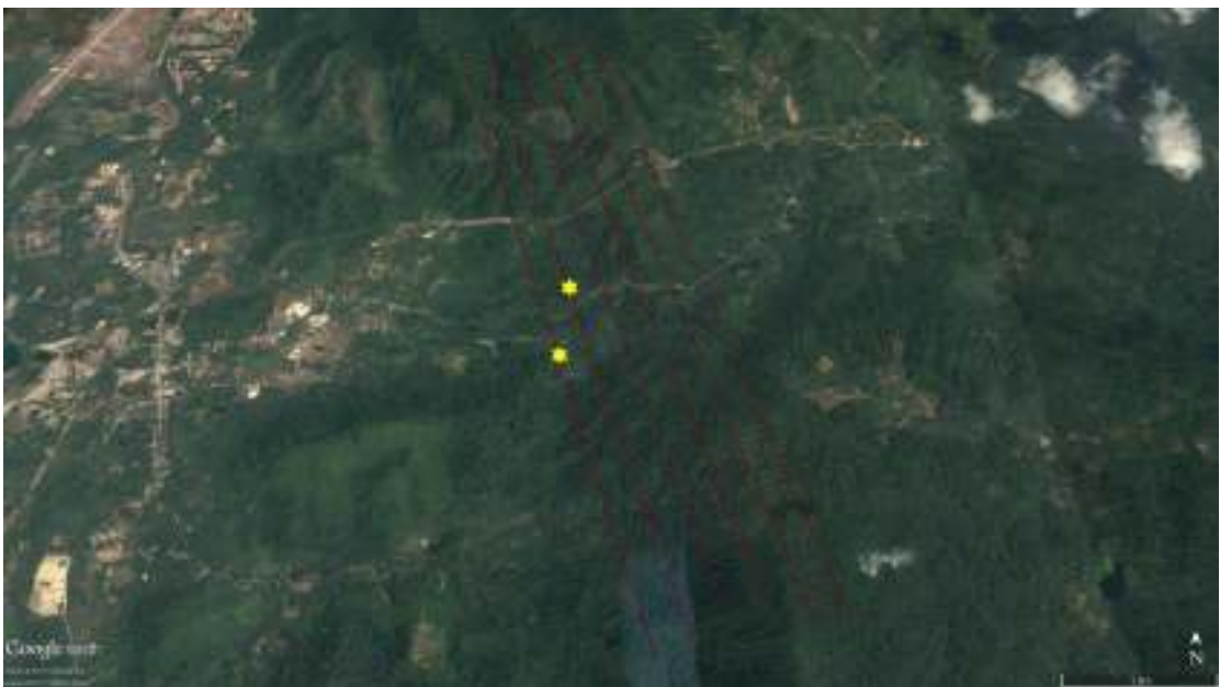
ภาพที่ 8 แนวสำรวจสัตว์ป่าและที่ตั้งแปลงพันธุ์พืช