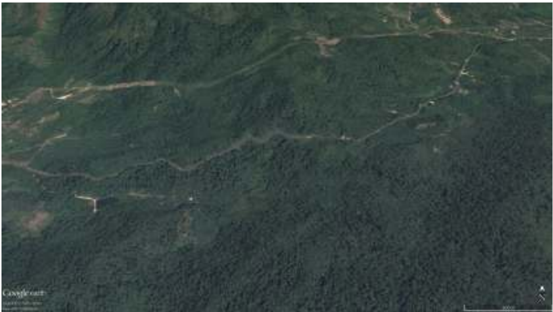
ภาพที่ 7 ภาพถ่ายทางอากาศแสดงทางหลวงชนบท หมายเลข 4006 ที่ตัดผ่านพื้นที่ดำเนินการ